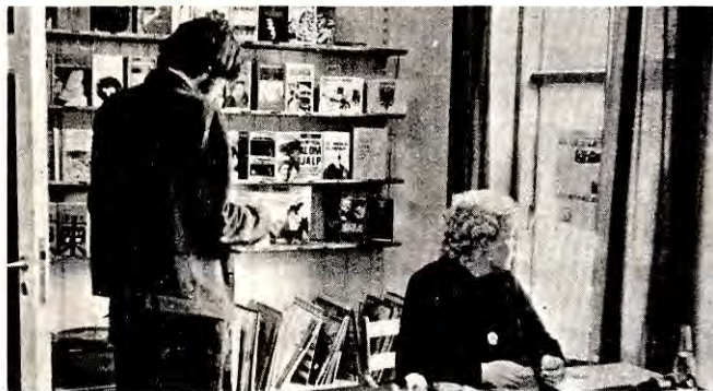
Inne i butikken