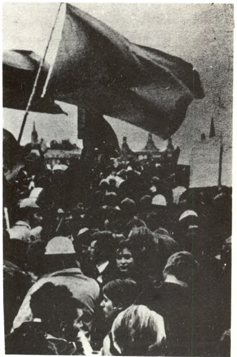
Studentdemonstrantar i Bonn.

- Det måtte vere dei som seier at dei alle fall ikkje skal gå i samorg.toget, men at dei ikkje veit kva dei skal gjere. Difor vil dei ikkje gjere noko med 1.mai no. Nokre seier og at 1.mai ikkje er så viktig. Etter mi meining er dette ein bakvendt måte å sjå det på. Det å seie at 1.mai ikkje er viktig er å stele denne dagen frå arbeidarklassen. I komiteane diskuterer vi dei ulike linene for 1.mai, og er med på å forme ut politikken. Alle progressive pliktar å vere med å forme 1.mai dagen.