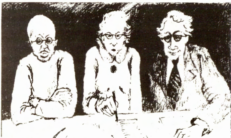
Vil du at disse skal bestemme om du kan få abort?

Samtidig blir vi hindra i å få prevensjon. Hvis vi i det hele tatt får sånn undervisning kommer den enten for seint eller er totalt latterlig. Hvordan kan filmen «Petter Frosk Blir Far» hjelpe noen med hva slags prevensjon de skal bruke, eller åssen komme seg til lege. Dessuten er prevensjon dyrt! Disse problemene må vi stri med helt aleine. Det viser bare at staten ikke bryr seg et sekund om våre problemer. De fine orda i mønsterplanen og alt pratet om at det er så lett å skaffe seg prevensjon er bløff!