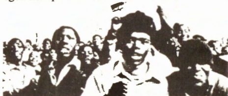
Svarte ungdommer satser sine liv i kampen mot rasismen.

Vi vil ikke holdes utafør det som skjer i verden. Vi har meninger om det og dem skal vi fram med på 8. mars. Vi vil lære av kvinnene og hele folket i den 3. verden som reiser kampen under de verste forhold som finnes — under fascismen og imperialismen. Vi vil støtte dem og reise våre egen kamp mot de samme fiendene.