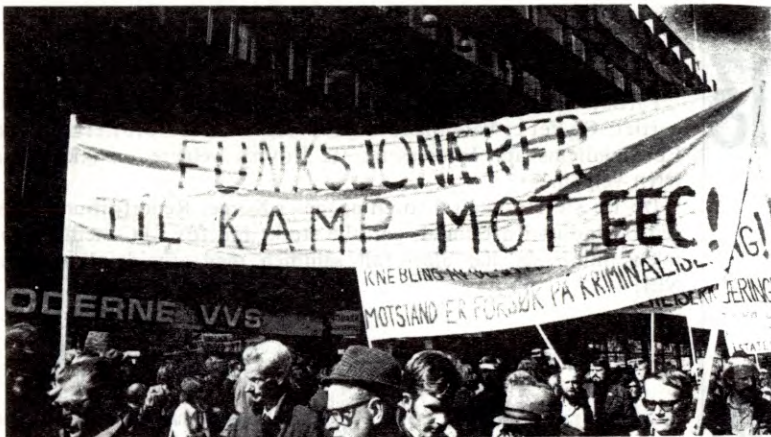
Funksjonærer i 1.mai-demonstrasjon i Oslo 1972

De statlige og kommunale funksjonærarbeidsplassene vil også bli utrygge. Hovedpostene på statsbudsjettet skal fastlegges sentralt i Brussel (iflg. Wernerplanen) og antallet funksjonærer i de forskjellige grener av statsadministrasjonen er helt avhengig av størrelsen av bevilgningene.