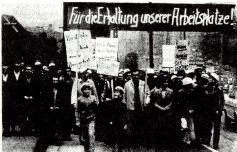
Tyske arbeidere demonstrerer: Vi vil beholde arbeidsplassene våre

tollbelastning på ca. 55 mill. kr over 10–12 år. Til sammenlikning betaler eksportindustrien ca. 1400 mill. kr i skatter og avgifter til staten. Tollen er altså en ubetydelig hindring for eksporten.