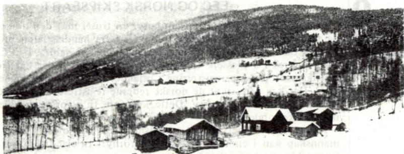
Mye større bruk enn dette blir idag nedlagt i EEC

Norge har alt i dag en lav grad av sjølforsyning når det gjelder matvarer. I tilfelle medlemskap i EEC vil graden av sjølforsyning bli ytterligere svekket. Bare med sjølråderetten i behold kan vi føre en jordbrukspolitikk som sikrer den bosettinga vi ønsker her i landet, og som sikrer oss et minstemål av sjølforsyning når det gjelder mat.