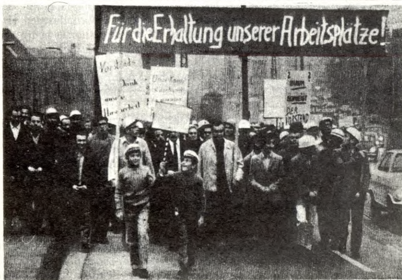
Tyske arbeidere demonstrerer: Vi vil beholde arbeidsplassene våre.

Markedsrapporter roser de den strukturrasjonalisering som foregår i EEC. Ja, de skriver rett ut at det er positivt for fellesskapet når sentraliseringen skrider fram. Men de er helt ute av stand til å tenke seg hvilke følger dette har for folk flest. Hvor langt borte Arbeiderpartiet står vanlige folk hadde vi et eksempel på i Stortinget da en a-representant henstillet om at det ble satt i gang ukentlig transport av nord-norske arbeidere til Nordsjøfeltet og boreplattformene der, slik at de kunne bli vant til slikt allerede nå. Regjeringens krokodilletårer over masseoppsigelsene i Drammensvassdraget og i Halden er bare en forsmak på hva som venter i EEC. Konkursene i tremasse, cellulose osv. er et direkte resultat av rasjonaliseringsplaner som bl. a. Bergens Privatbank har skaffet til veie. Nettopp slike strukturendringer er det Kommissjonen i EEC setter så stor pris på.