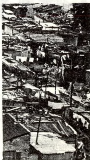
Fremmedarbeidere i EEC: Dårlege arbeidsforhold – elendige boligforhold.

Hvorfor? Romatraktaten krever fritt arbeidsmarked. Kapitalen har behov for billig og mobil arbeidskraft. Tidligere besto disse av vandrearbeidere fra EEC-landene. Årsaken til at det i dag kommer flest fra Nord-Afrika, Tyrkia osv. forklarer regjeringens Markedsutvalg slik: ». . .at italiensk kvinnelig arbeidskraft er lite mobil . . . » ». . .at italienere i stadig synkende grad er villig til å ta særlig tungt eller smuss-utsatt arbeid». Men dette er altså nå andre villig til å påta seg. Disse menneskene drar som regel hjem (les: blir hjemsendt) når de nærmer seg pensjonsalder og når de har vært i landet lenge nok til å kreve sosiale ytelser. De må levere arbeidskraften billig for i det hele tatt å få arbeid.