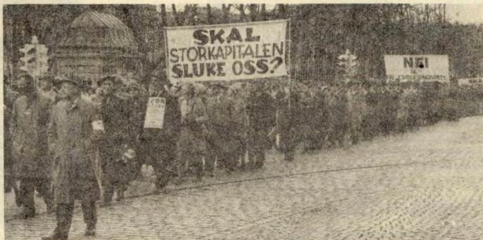
Fra EEC-demonstrasjonen i 1962

Folkebevegelsen markerer seg med en landsomfattende aksjonsuke i tiden 1.-7. juni. Lokalutvalgene i alle deler av landet arrangerer stands med rikholdig utvalg av Folkebevegelsens opplysningsmaterieil. Aksjonsplakater, møter, appeller og demonstrasjoner skal vise hva saken dreier seg om, før Stortingets store markedsdebatt i juni. Hovedparolen for aksjonsuka er: Nei til EEC-medlemskap. Bryt forhandlingene. Meningsmålingene viser at bare 12 prosent av det norske folk er for medlemskap i EEC. Men de viser også at hele 40 prosent ennå ikke har dannet seg noen mening om saken. Aksjonsuka skal vise hva saken gjelder. Det blir arrangert folketog i Oslo, Stavanger og Trondheim.