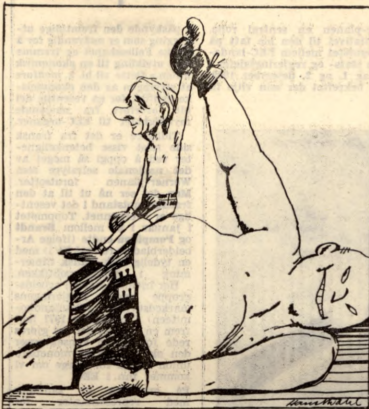
(Forts. fra side 1)

Det eneste løfte vi har fått, er altså at det skal treffes «egne tiltak for å sikre melkeforsyningen». Hva disse tiltak skal gå ut på, er det Ministerrådet som bestemmer. En mulighet som har vært antydning, er at det betales et tilskudd pr. ku — slik at vi risikerer å få tilbake tidligere tider form for fedrift med store sulførede besetninger. En annen mulighet er at det sørges for frakt av melk til Sørlandet, Vestlandet og Nord-Norge fra Østlandet og Trøndelag eller fra utlandet. Etter den norske teksten ser det imidlertid ut til at også prissubsidier på melk kan brukes — hvis Ministerrådet finner grunn til det.