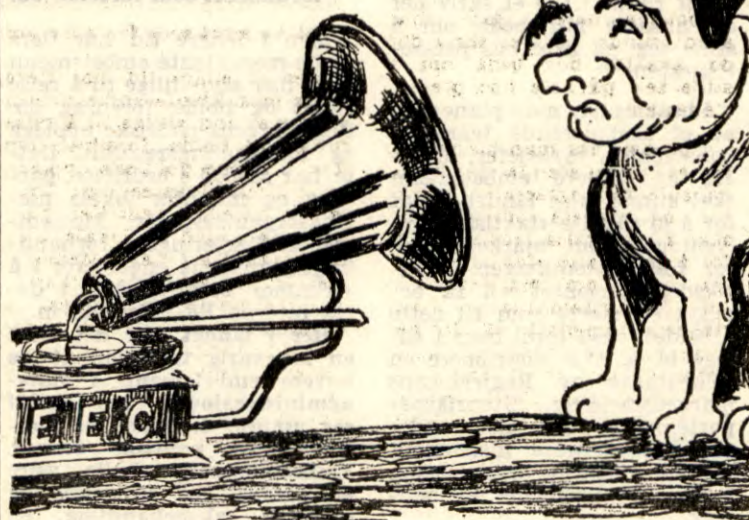
Melding med slagside (Tegning: Bjørn Ostrø)