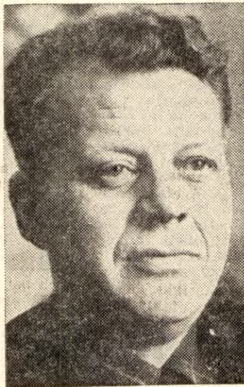
sursane på Kontinentalsokkelen osv.

Det er vidare uttrykk for ein alt for ein-sidedig tankegang å vurdere ein handelsavtale berre ut frå dei vilkåra norsk eksportindustri får ved ein handelsavtale samanlikna med fullt medlemskap, og ut frå dette uttala seg om handelsavtalealternativet er tjenleg for Noreg eller ikkje. Når ein gjer ei slik snever samanlikning, «gløymer» ein at det norske folk ved å svara nei til fullt medlemskap, samstundes tok stilling til ein lang rekkje andre faktorar av interesse i denne samanhengen, slik som full norsk suverenitet og sjølvråderett, full friidom til å føra ein sjølvstendig distrikts- og jordbrukspolitikk, fortsatt norsk råderett over naturres-