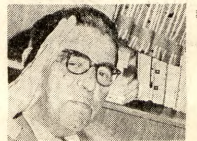
har noen som helst mulighet for å bli vedtatt».

I en artikkel fra Høyres Pressebyrå, «Nei-folk på Tinget», blir det sagt om dette forslag: «— som for øvrig ikke