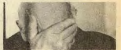
Sicco Mansholt, her under sin første pressekonferanse som nyutnevnt president i EF-kommisjonen.