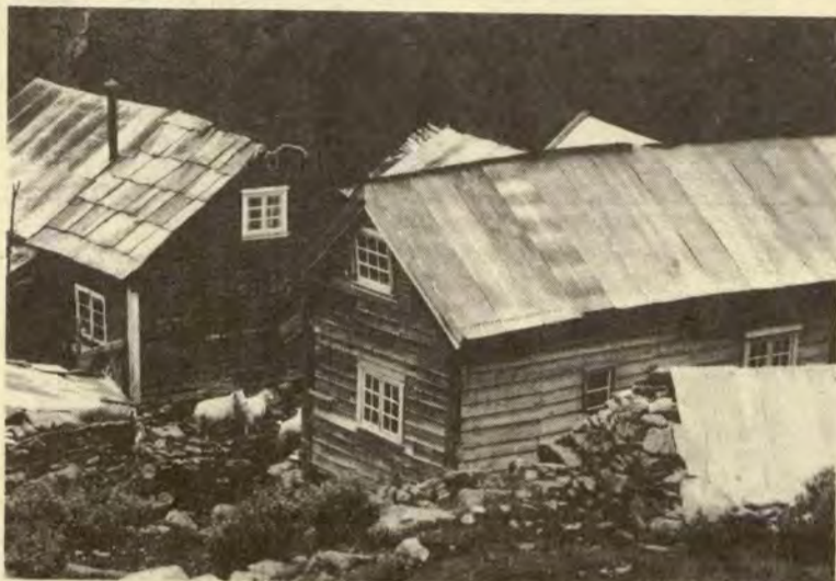
slike begrensninger ikke var etablert".

For Norges vedkommende har talsmann for Kommisjonen gjentagne ganger gitt uttrykk for at praktisk talt hele vårt land — med unntak av Oslo-gryta — vil komme med blant de "perifere områder". Ettersom de nasjonale myndigheters syn ble tillagt stor betydning ved den opprinnelige deling av de seks, skulle det ikke være noe problem for Norge å få dette syn godkjent av Rådet. Også det regjeringsnedsatte "Skånland-utvalget" regner med dette, og antar vedtaket vil føre til at "det ikke blir nødvendig å bruke så sterke virkemidler i konkurransen med andre land om etablering, som i det tilfelle at