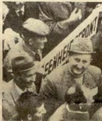
EF-bønder demonstrerer mot Mansholts landbruksplan. — Men de valgte feil mann, hevder sosialisttidsskriftet AGENOR.