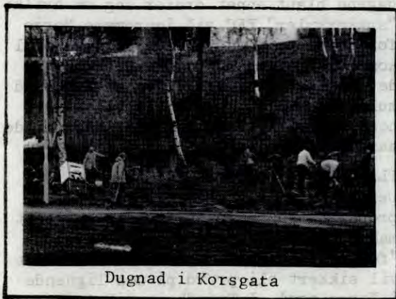
Dugnad i Korsgata