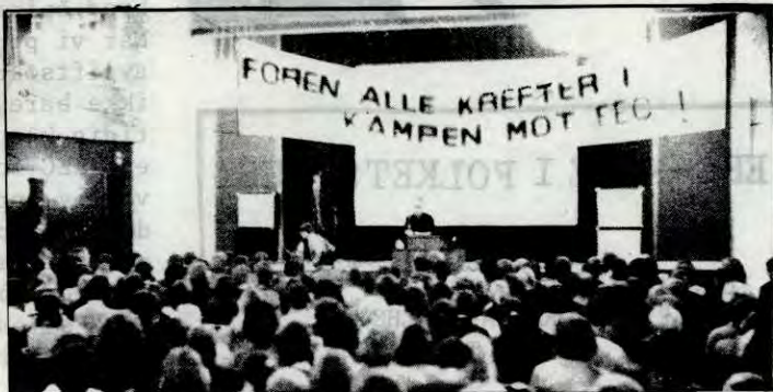
Fra folkemøtet i Folkets Hus fredag 17/9