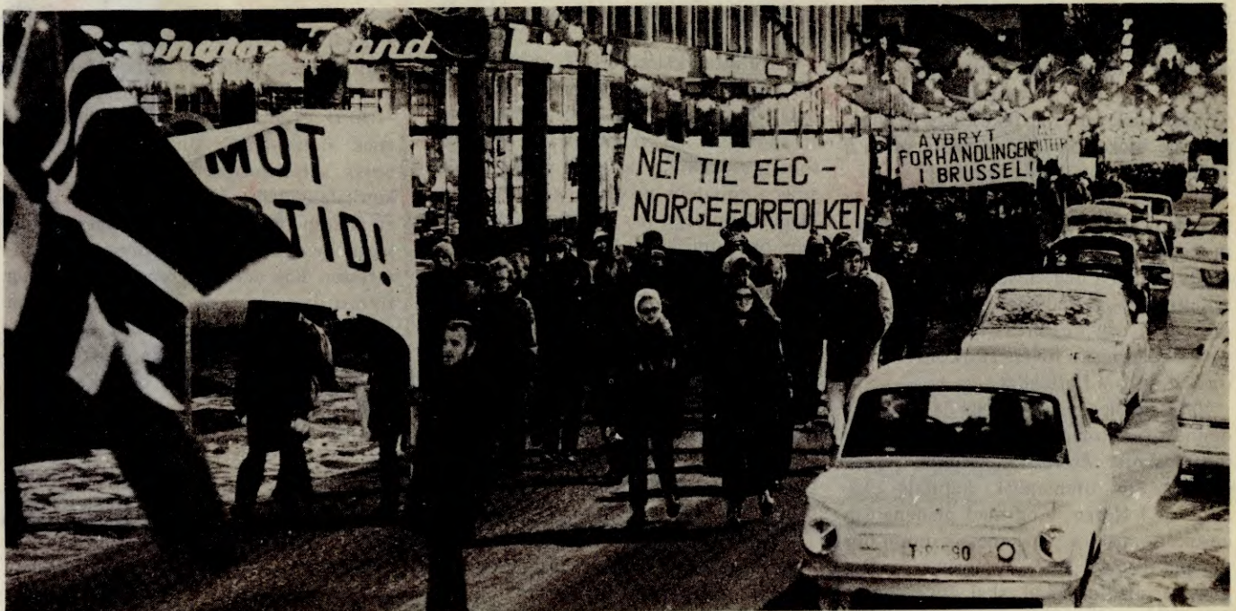
Fra Arbeiderkomiteens demonstrasjon i Trondhjem 2. desember 1970

Den norske storkapitalen og dens politiske talerør vil ha Norge inn i EEC. De vil overdra all nasjonal suverenitet til monopolenes byråkrati i Brussel. EEC's overstatlige organer skal vedta lover som er bindende for det norske folket. Utenlandske konserner skal fritt kunne etablere seg i landet. Norske arbeideres kamp vil bli møtt med den europeiske kapitalens felles undertrykkelse. Utkantstrøka skal legges øde. Den folkelige kulturen brytes ned. EEC er monopolenes fellesskap, rettet mot arbeiderklassen og hele fol-