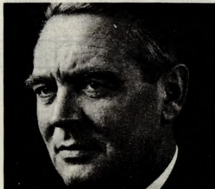
Krupp-lederen Berthold Beitz, IKKE BARE I EEC

merzbank og Dresdner Bank – aksjemajoriteten.