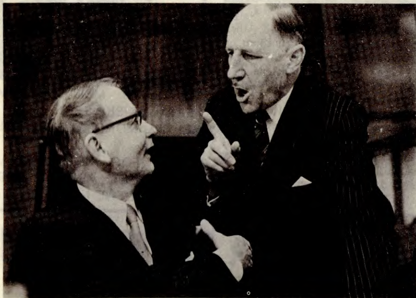
Cappelen i Brussel. Mannen som alt har tatt fram pekefingeren er minister-rådsmedlem Joseph Luns

Forhandlingene om norsk medlemskap i EEC foregår nå for fullt i Brussel. «Krav» fremlegges og gledestrålende meldinger sendes ut om at EEC-byråkratiet stiller seg «positivt» og «velvillig» til de norske forhandlernes synspunkter. Det skulle nå også bare mangle, så lenge hele forhandlingsopplegget nettopp tar sikte på å imøtekomme de store monopolkapitalistenes ønske om kontroll over det norske markedet.