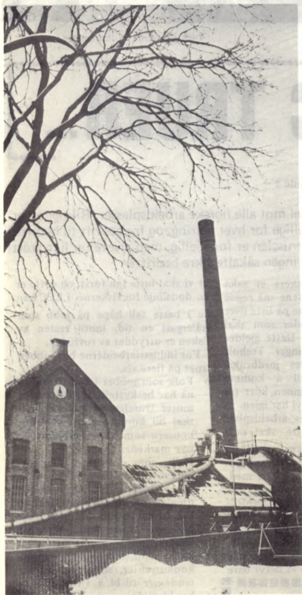
Bare en forsmak: Vestfossen Cellulosefabrikk