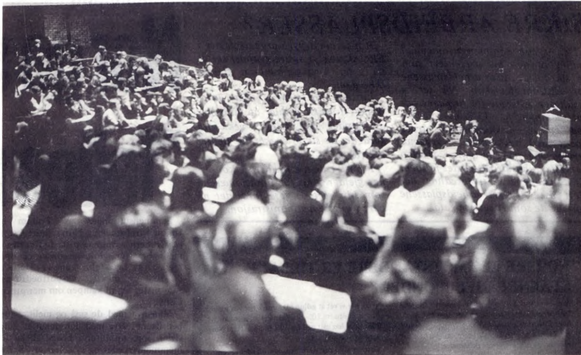
FRA UNIVERSITETSKONFERANSEN MOT EEC, DER MER ENN 700 DELTOK.

AKTIVISER EEC-MOTSTANDEN PÅ DIN EGEN ARBEIDSPASS! SETT DE FIRE PUNKTENE RASKT UT I LIVET!