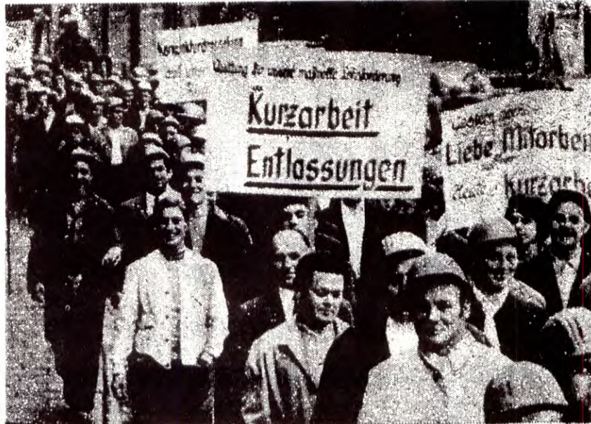
tyske arbeidere demonstrerer

Konklusjonen er at bare en håndfull norske bedrifter vil tjene på EEC-medlemskap. Ikke engang disse vil være sikre på å bli i norske hender særlig lenge. Hardest rammet blir den norske arbeiderklassen. Det den har brukt krefter på å irtide for å oppnå, vil med ett slag bli fratrukket den. Arbeidsledighet bortearbeid, faglige tvangslover og synkende reallønn er det som venter i Brussel. Skal vi slutte oss til hæren av arbeidsløse? Skal vi reise over landegrensene slik belgiske kamerater gjør for å få arbeid? Skal vi få anti-streike lover som innebærer fengsel hvis vi må gå ut i en «ulovlig» streik, slik det engelske forslaget er? Skal vi gå ned i reallønn slik vest-tyske arbeidere nå gjør? Dette nevner aldri Bratteli med ett ord, men dette er konsekvensene av EEC-medlemskap!