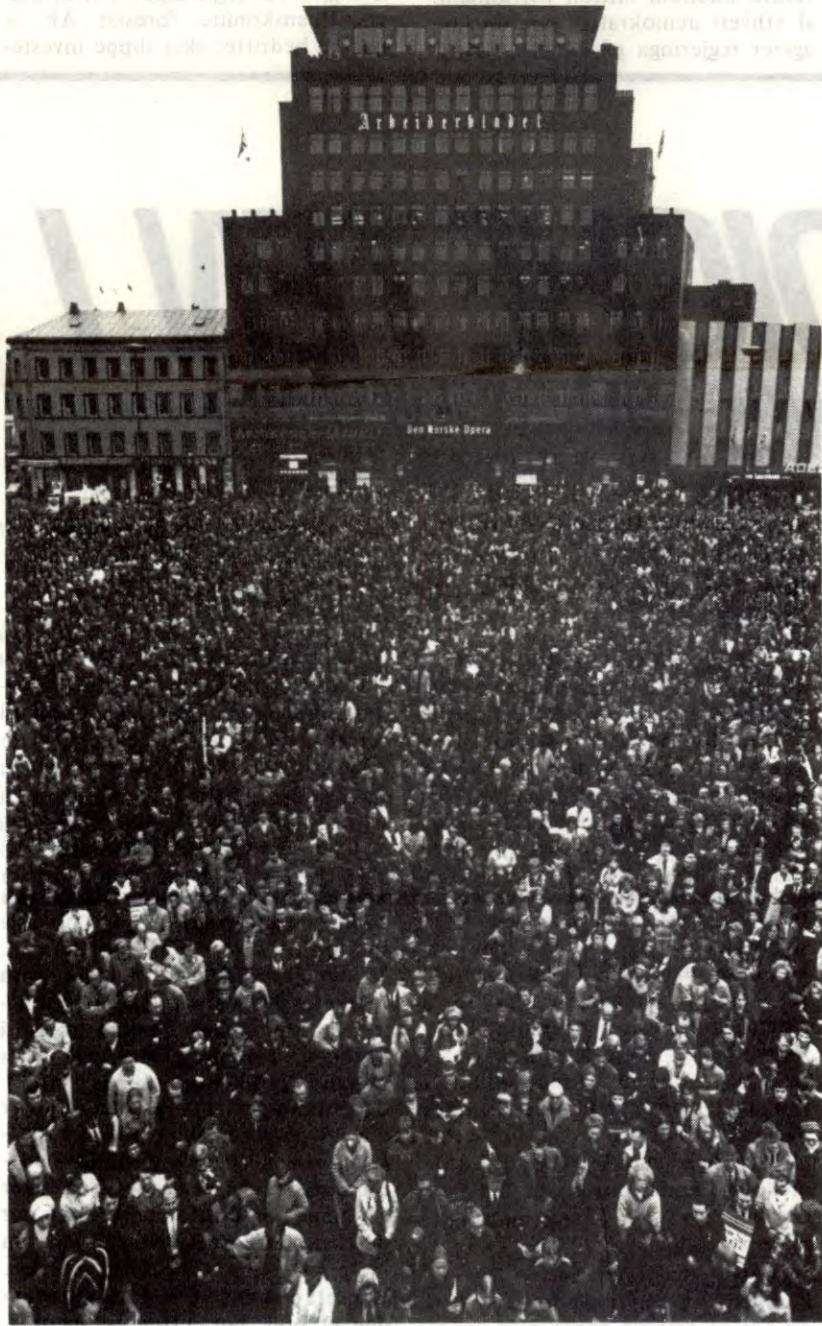
Youngstorget i Oslo ble for lite for anti-EEC-toget 1. mai