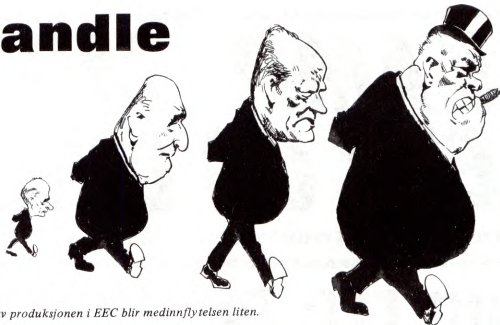
Med bare 1,8% av produksjonen i EEC blir medinnflytelsen liten.

Mansholt er president i Kommissjonen og kalles sosialist. Han innrømmer til tross for det at sosialister ingen innflytelse har. Hvem bestemmer EECs politikk? Mansholt gir selv svaret: «På den annen side har storindustrien, de multinasjonale selskapene en enorm makt i Europa. Stadig blir det flere sammenslutninger. De bestemmer hvor industri skal nedlegges og hvor den skal opprettes. Ingen kan influere på dette». Mansholt forklarer at «dette er nødvendig om industrien skal konkurrere med tilsvarende