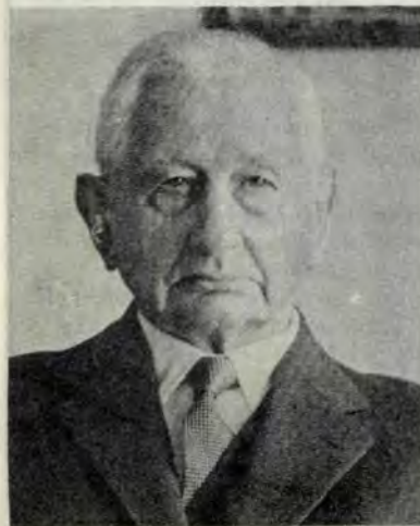
Rustningsfabrikant Flick har stor profitt av produksjonen av panservognen Leopard.

»Aldri mer produsere våpen», sa Alfried Krupp von Bohlen und Halbach da han ble sluppet ut fra fengslet i 1951. »EEC betyr fred», sier EEC-tilhengerne i dag. Vi tror ikke på slike folk.