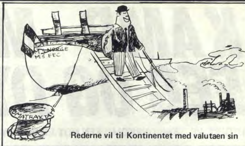
Rederne vil til Kontinentet med valutaen sin

overdrivelse at »hele det norske arbeidsliv er bygget opp på valutainntektene fra skipsfarten», slik Rederforbundet hevder, vil det, med den oppbyggingen norsk næringsliv har i dag, utvilsomt få store konsekvenser dersom de milliardbeløp flåten seiler inn blir trukket ut av landet og låst fast på Kontinentet.