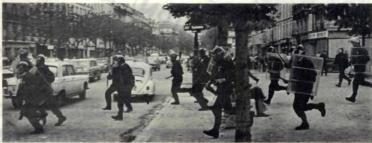
Franske spesialbrigader i mai 1968

Da statsminister Chaban-Delmas i mars besøkte Alsace-Lorraine, ble han møtt av »De døde byers aksjon». Det var fagforeningene som reiste denne protesten mot regjeringas politikk fordi industrien i området »på det hardeste er rammet av rasjonalisering, fusjoner og nedleggning av småbedrifter». Bl. a. skal stålkonsernet Wendel-Sidelor si opp 12 000 de nærmeste tre år. Forholdene er så ille for arbeiderne at biskopen i Arras lot dødslokkene ringe i hele bispedømmet. (Frankfurter Allgemeine Zeitung, 2/3-1972)