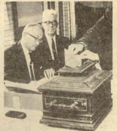
Delta i folkeavstemningen

Det er også av betydning at ikke medlemskapstilhengerne splitter motstandergrupperingen i flere fraksjoner for å påberope seg støtte for sin EEC-politikk ved å henvise til at den "største velgergruppen er for medlemskap".