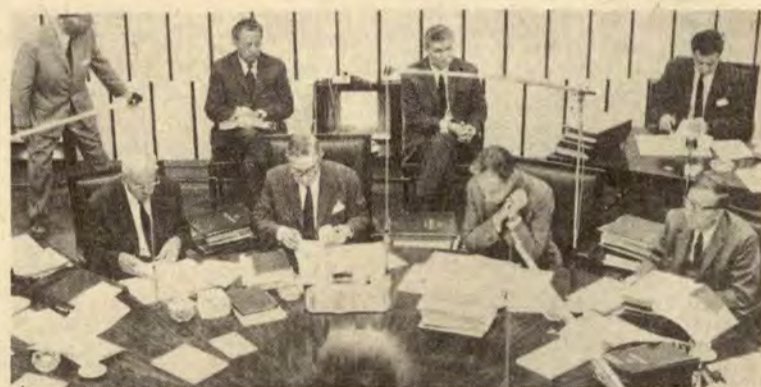
Kommisjonen: bare menn

Antallet kvinnelige parlamentsmedlemmer i Italia har sunket drastisk de siste år — i 1948 var det 7%, i 1953 — 5,6%, i 1958 — 3,7%, i 1963 — 3,4% og i 1970 var antallet kvin-