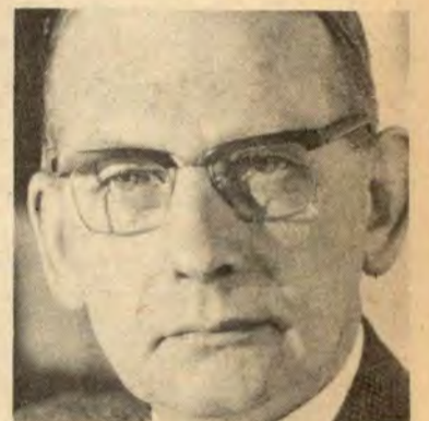
Utenriksminister Capelen (DNA)

nes traktater og deres politiske målsetting, de vedtak som er truffet etter traktatens ikrafttreden og de vedtatte retningslinjer for Fellesskapenes fremtidige utvikling. På min regjeringens vegne kan jeg bekrefte at dette fortsatt er grunnlaget for Norges forhandlinger.»