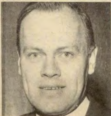
Forhenv. utenriksminister Stray (H)

For i det hele tatt å kunne forhandle om norsk medlemskap i EEC, har den norske regjering reservasjonsløst godtatt Romatraktaten. De prinsipper som Romatraktaten bygger på forhandles det derfor ikke om!