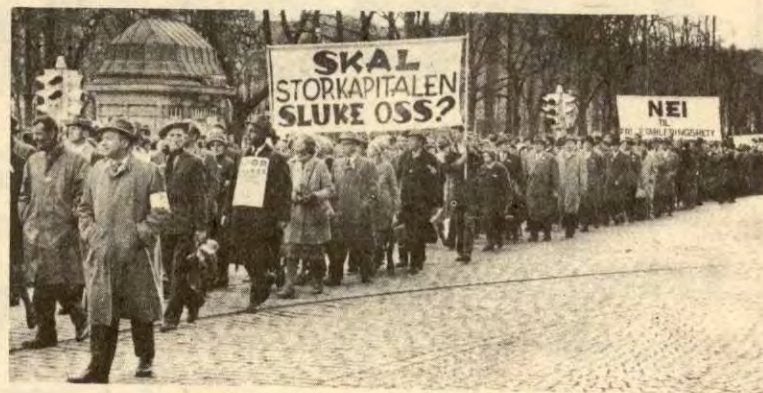
Fra EEC-demonstrasjonen i 1962

I EEC er det ikke plass for de små og "urasjonelle" bedriftene. Og i spillet om høyest mulig effektivitet og størst mulig