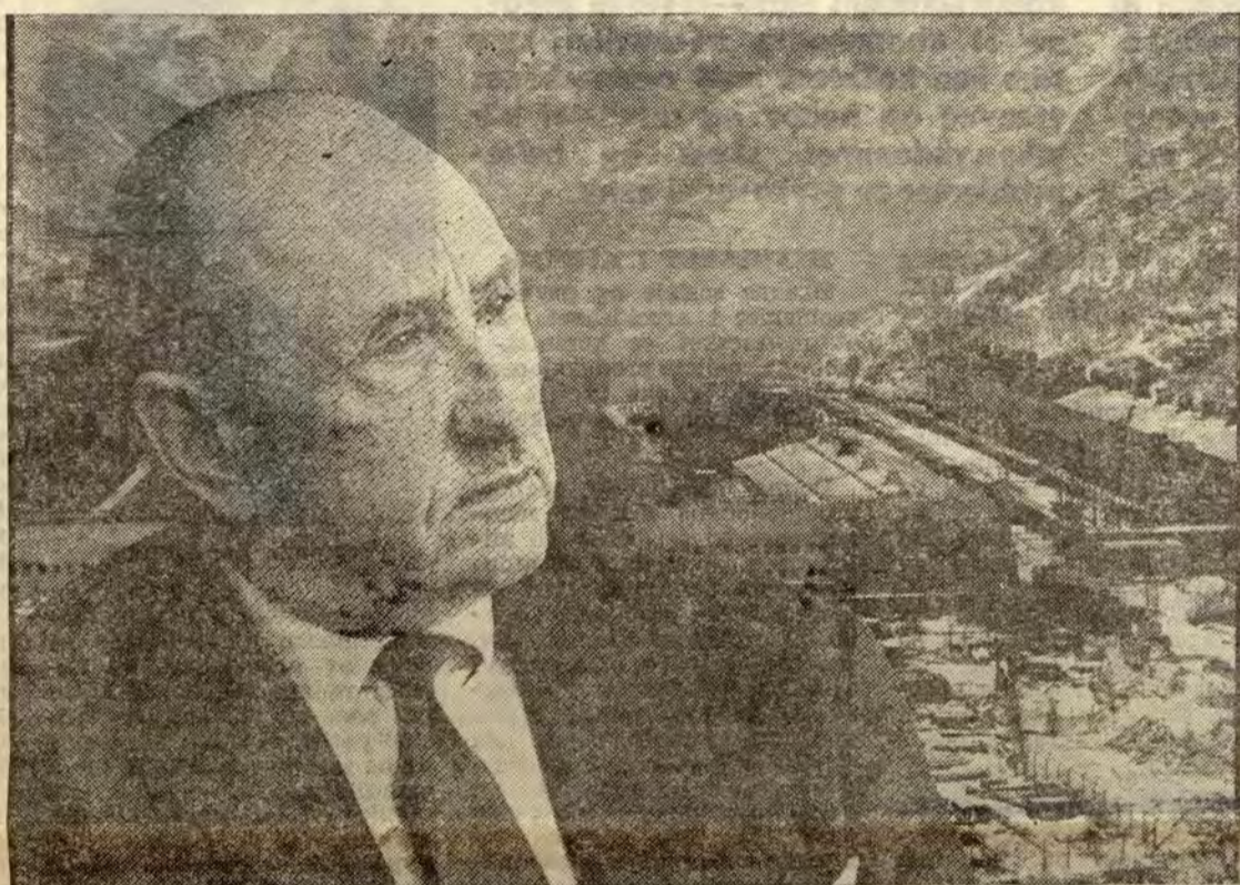
Generaldirektør Michelet og ASV tåler å stå utenfor EEC.

— En god del av en slik tollbelastning vil ventelig norske bedrifter slippe å betale selv: De fleste aluminiumsbedrifter i Norge tilhører internasjonale aluminiumskonserner. De norske bedriftene får råstoff fra sine moderkonsern og leverer i stor utstrekning metallproduksjonen til konsernens videreforedlingsbedrifter i utlan-