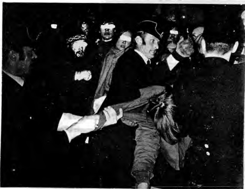
Noen av politifolkene var ivrigere i tjenesten enn andre.

Vi må altså kunne summere opp at aksjonen mot filmen fylte hensikten, nemlig å forhindre at løgnpropagandaen blir vist på norske kinoer. De anslagsvis 700 EEC-motstanderne - rimeligvis i hovedsak ungdom - som deltok i aksjonene mot filmen, og det store antallet EEC-motstandere som støttet kravet om at filmen skulle av plakaten har gjort en viktig erfaring. Det nytter å kjempe, er vi mange og står vi sammen skal vi ikke bare klare å slå tilbake tilhengernes løgnpropaganda - da skal vi også vinne kampen mot EEC!