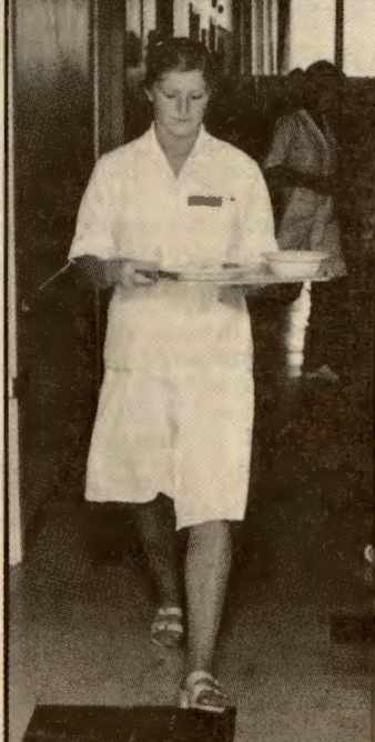
1000 jobber, de fleste i skole- og helsevesen skal bort fra kommunebudsjettet.

I teorien skal dette skje ved naturlige avganger, og interne overflyttinger. Om det holder i praksis, ja, det får vi nok se.