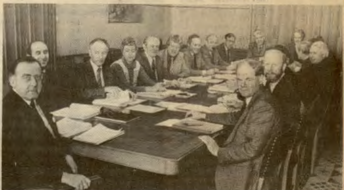
Finansutvalget i Oslo kommune. 8 rådmenn og 9 kommunalræder. Hver med en årslønn på minst 224 480 kroner. Til sammen betaler vi dem årlig over 4 millioner.

Gjennom statlige vedtak har staten «tatt» omtrent 1 milliard fra Oslo kommune. Regjeringa har bedt kommunen ta igjen dette ved å kombinere nedskjæringer og avgiftsøkninger. Finansrådmannen har lo- jalt fulgt pålegg fra regje- ringa. Til sammen øker de kommunale avgiftene i Os- lo med 358 millioner kro- ner.