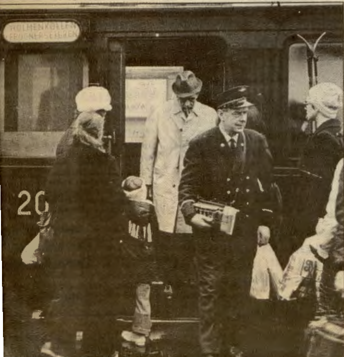
Rikkeprisene går opp til 6 kroner for voksne, 3 for barn. Dette er bare ett av utslaga av budsjettet.