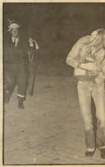
Er det hit Oslo kommune vil drive

I dag har Oslo 31 fritidsklubber. Alt i alt er det rundt