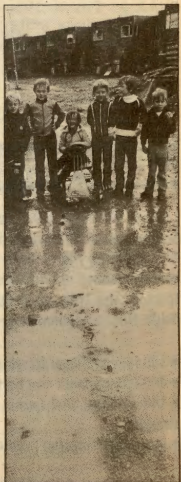
Barnehager, sjukehjem og skoler kommunen har lovet bevilgninga i Oslos drabantbyer, blir likevel ikke bygd.