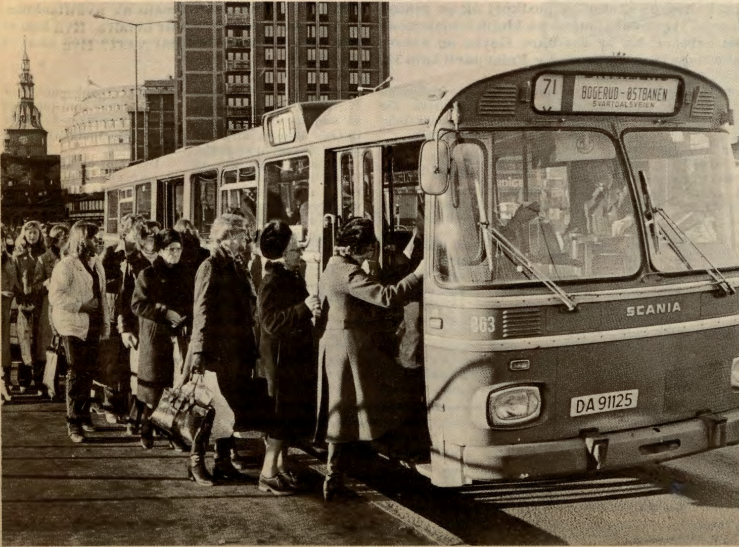
Sporveisbudsjettet-81: Prisheving og økte køer for publikum, større arbeidspress for betjeninga.