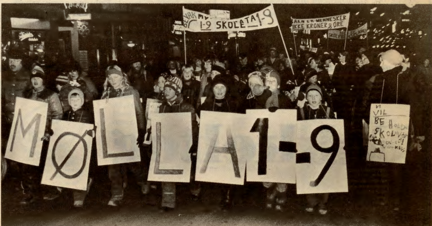
Bevar sentrumsskolene — Bevar bydelene.

Funksjonshemmede: Bevilgningene til transport av funksjonshemmede har gått ned fra 71,9 millioner til 40 millioner kroner. Dette betyr enda dårligere muligheter for de funksjonshemmede til å delta i samfunns livet. De funksjonshemmede har bl.a. rett til fire reiser i måneden. Dette vil bli redusert til tre reiser.