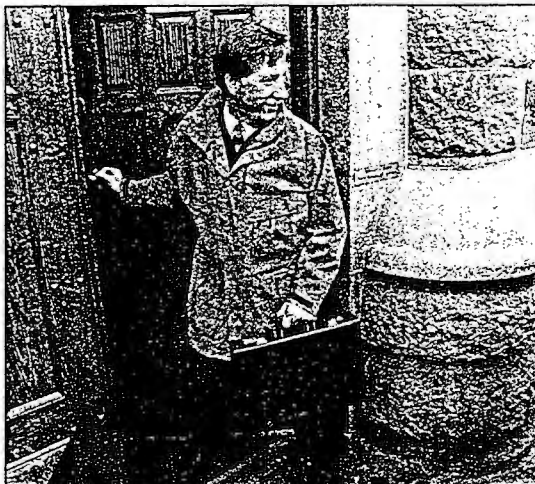
Finansminister Sigbjørn Johnsen er raus med de rike, men skatlegger de mindre rikes ekstrainnsats hardt.

Men likningsprotokollen ljuger i dette tilfellet, og i alle tilfelle der det står å lese at aksjonærer har betalt skatt av aksjeutbyttet sitt. De snirklete bestemmelsene om «godtgjørelse» i selskapsskattelovens kapittel 3 er laga med ett mål for øye: Å skjule nullskattytere. Selv om ordlyden kan synes uforståelig, så er innholdet i bestemmelsen enkelt: Aksjonæren skal ikke betale ett i øre skatt, men det skal stå i likningsprotokollen at han har betalt 28 prosent skatt av mottatt aksjeutbytte. Med en slik lov blir Bærum likningsprotokoll lovlig, selv om den er i strid med faktum! Når Finansdepartementet så oppgir at det utbetales 19,7 milliarder i utbytte til norske aksjonærer i 1995, er det enkelt å regne ut at 5,5 milliarder «luftskatt» kommer til å ligge skjult