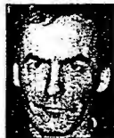
Erling Folkvord stortingsrepr.

Jeg vet heller ikke hvor mange av Bærum millionæren som mottar aksjeutbytte i tillegg til sin øvrige inntekt. Men de som gjør det, kan glede seg over at slik ekstrainntekt er skattefri. Dette gjelder uavhengig av hvor stort aksjeutbyttet er.