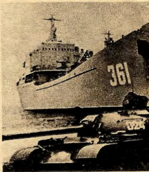
Sovjet har flere ganger trent i lar russiske stridsvogner fra landgang

Evensens avtaleutkast betyr at Norge fullstendig gir opp midtlinja.