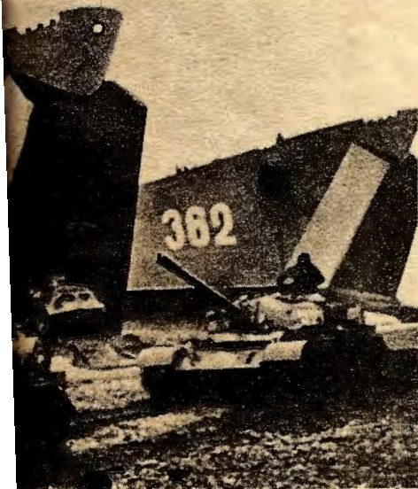
på norskekysten. Her landsettes av «alligatorblassen».

SV-ledelsen og «NKP» har markert seg som Sovjet-herskernes mest lojale agenter ved umiddelbart å rykke ut til forsvar for Evensen's avtaleutkast. Dette viser hvordan den moderne revisjonismen alltid tjener imperialismen. Når Berge Furre hevder at avtalen vil sikre fred og avspenning i nord, så bruker han akkurat samme logikk som de som ville selge Tsjekkoslovakia til Hitler. Ideen om at ei aggressiv imperialistmakt blir mindre aggressiv om den får det den gjer krav på, er en livsfarlig ide som tjener de imperialistiske krigshisserne. SV og «NKP» har med sin politikk overfor Sovjet plassert seg på ei tilsvarende reaksjonær linje som den DNA og Høyre sto på da de ville selge den norske sjølråderetten til EEC.