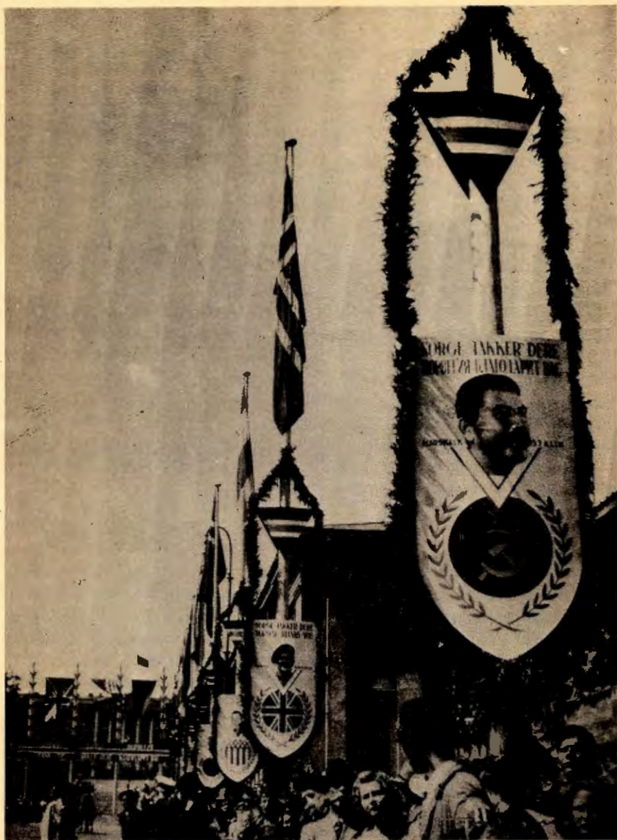
Oslo fredsvåren 1945. Stalin og det sosialistiske Sovjet vert hedra. I dag er Sovjet den farlegaste åtaksmakta i verda.