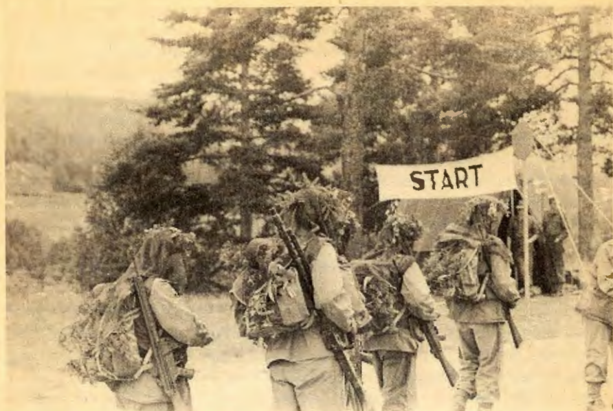
Heimevernet er ikkje rusta til å møte større fientlege styrkar. Her ser vi frå ein landskonkurranse i Heimevernet.

osb. Geriljakrig vil i regelen vera den einaste moglege stridsforma, i byrjinga av ein folkekrig i eit okkupert land.