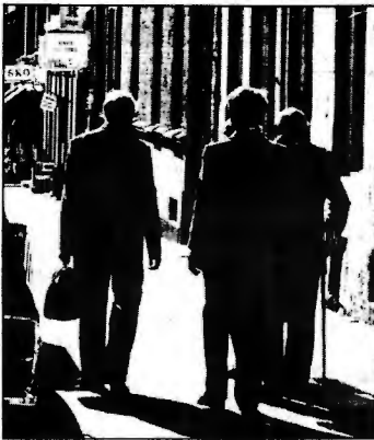
Tilbudet til de eldre er langt fra godt nok, innrømmer folk som stiller med eldreorsorg.