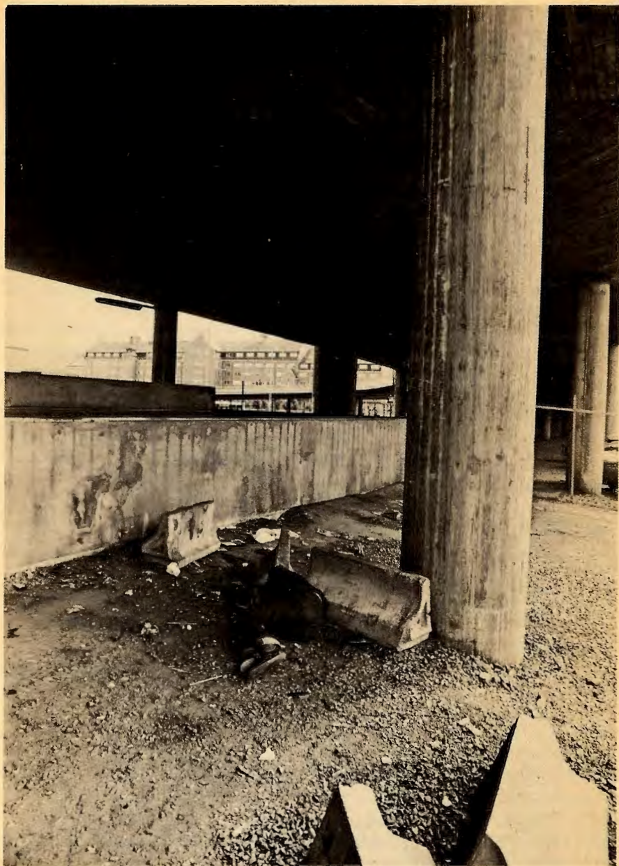
Samme rett til å sove under bruene...