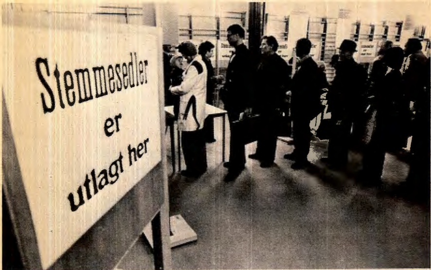
Stemningen ikke alltid på topp under SVs landsmøte?