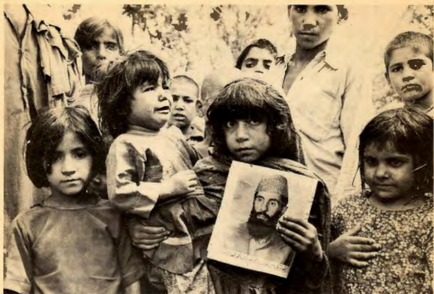
Afghanske barn i flyktningeleir i Pakistan. De er ofre for Sovjets imperialistiske krig.

For det tredje: Det finnes land som kaller seg sosialistiske, men som slett ikke er det. Dagens Sovjet er det fremste eksemplet. Når folk tror at sosialisme er det systemet som eksisterer i Sovjet i dag, er det forståelig at de foretrekker å brenne inne. Derfor er det nødvendig å slå fast at det sovjetiske systemet ikke har det minste med sosialisme å gjøre.