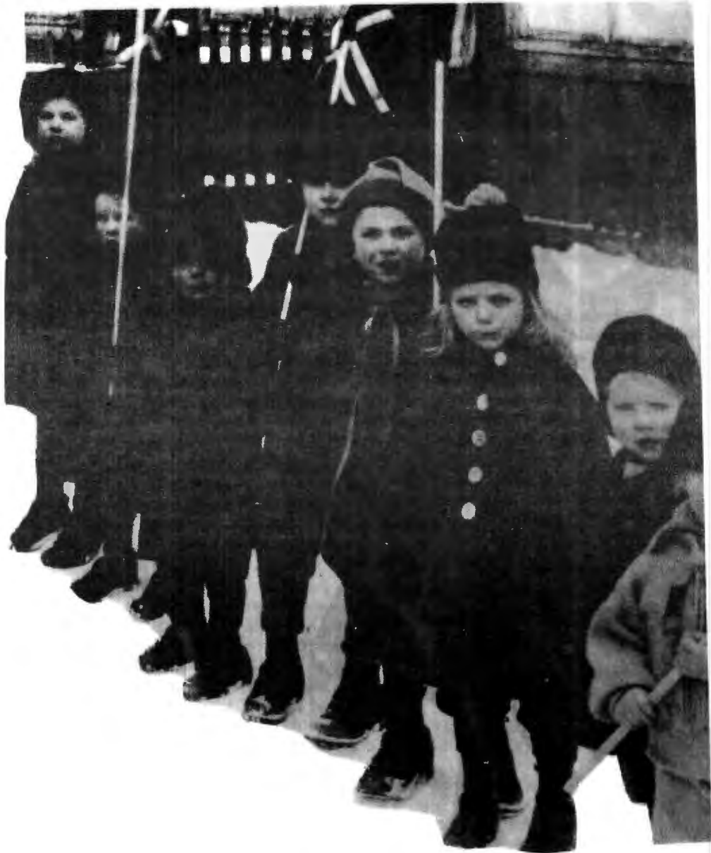
Bildet er fra "Hegdehaugens daghjem" fra en gang rundt århundreskiftet. Byrådsforslaget om stopp i utbygginga av barnehager, kommunal ansettelsesstopp og oppheving av ordninga med friplasser er i praksis å skru klokka tilbake. 8 000 unger står i kø for å få plass i barnehage. I de barnehagene som er, lider mange avdelinger av mangel på personell. Dette fører bl.a. til at 20 avdelinger må holdes stengt.