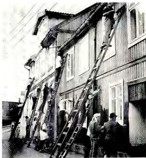
FRA EN DUGNAD PÅ RODELØKKA

På samme måte som vi aktivt vil gå inn for at folk på Rodeløkka sjøl skal bestemme sin framtid, vil vi kjempe for at Norge som nasjon skal bestemme sin. Vi ser fortsatt forsvaret av norsk sjølstendighet, mot innlemmelse i den europeiske storkapitals felleskap (EF) som en sentral sak.