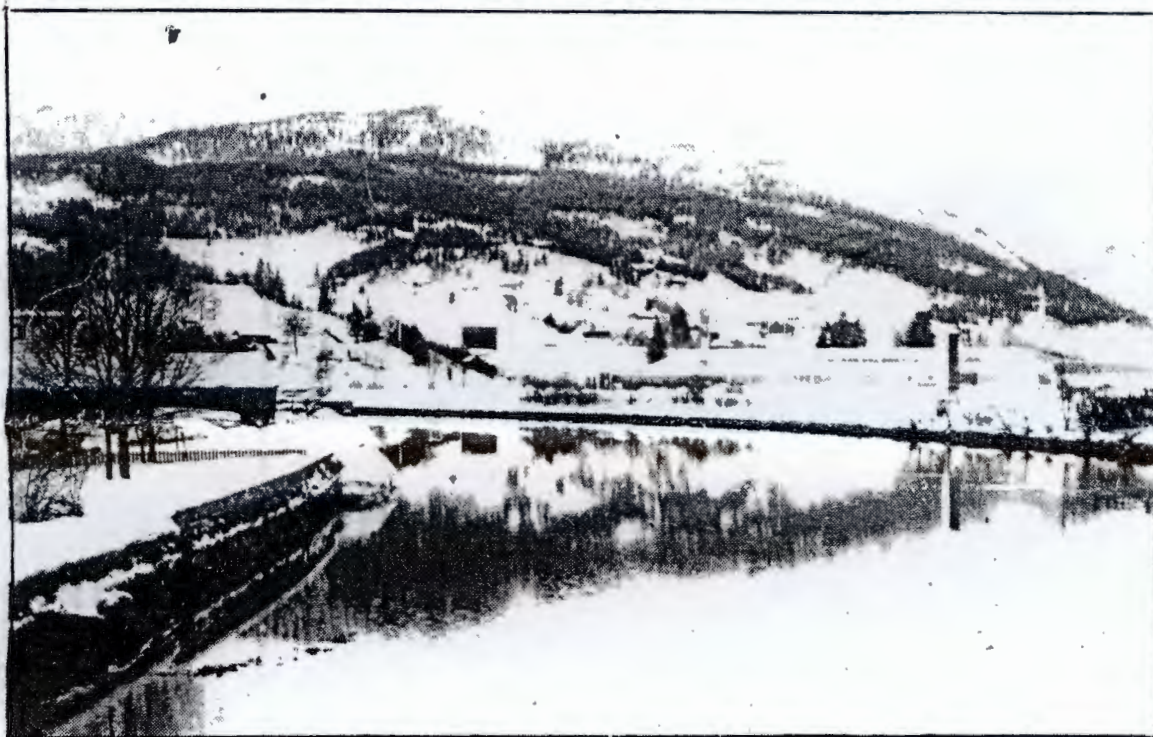
Førde i Sunnfjord — «vekstsenter for fylket». Kommunane rundt vert tappa for arbeidskraft, stadig fleire blir pendlarar. Kravet må vere: Arbeidsplassar der folk vil bu!

— Dei store sentralsjukehusa kan ikkje erstatte dei mindre, og eit sentralsjukehus som no er planlagt vil vere eit trugsmål mot dei små. Det ser no ut til at det