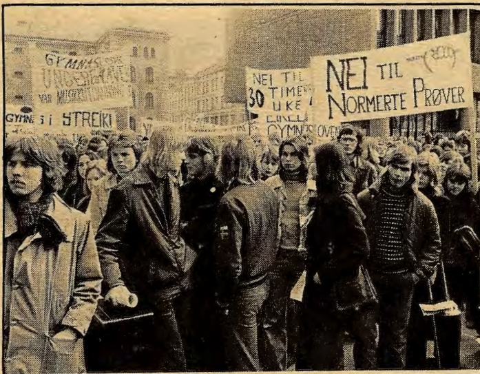
AP og SV har gått mot elevenes krav.

Mange ungdommer gjennomskuer dette spillet og ser ingen vits i å stemme i det hele tatt. Valgene får lite å si for hvordan framtida vår ser ut, men vi må ikke tro at de ikke er viktige for det. Dette spillet er arrangert av kapitalen for at vi skal tro at vi er