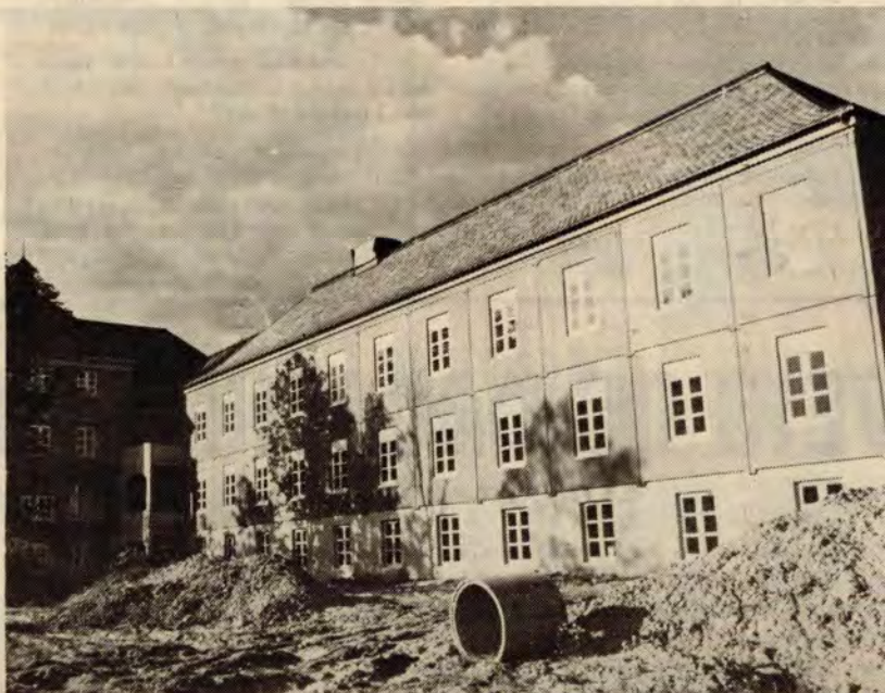
Dette tilbygget er det eneste konkrete vedtaket av utbyggingsplanen som de ansatte og pasientene vil få se de første åra.

— Sykepleierelevene er ei hardt utbytta gruppe. Utdanninga vår er prega av eksamenspress og karakterjag. I følge midlertidige vilkår skal vi ha 18 eksamener i altmen det som skjer i praksis er at disse blir kalt prøver, og vi får et antall som langt overskrider 18. Vi har dårlige arbeidsforhold og slitsom vaktordning. Elevene har funnet seg i dette altfor lenge og myten om at sykepleieryrket er et «kall», må avlives en gang for alle.