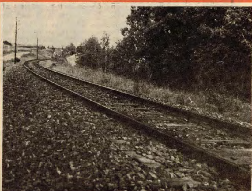
Tomme skinneganger — resultat av den nye samferdselsplanen.

Om DNA får sin vilje gjennom, vil Samferdselsutvalgets planer om å rasere arbeidsplasser og transporttilbud bli gjennomført. Her i Buskerud vil dette bl.a. bety nedlegging av Numedalsbanen og nedlegging av mange lokalstasjoner.