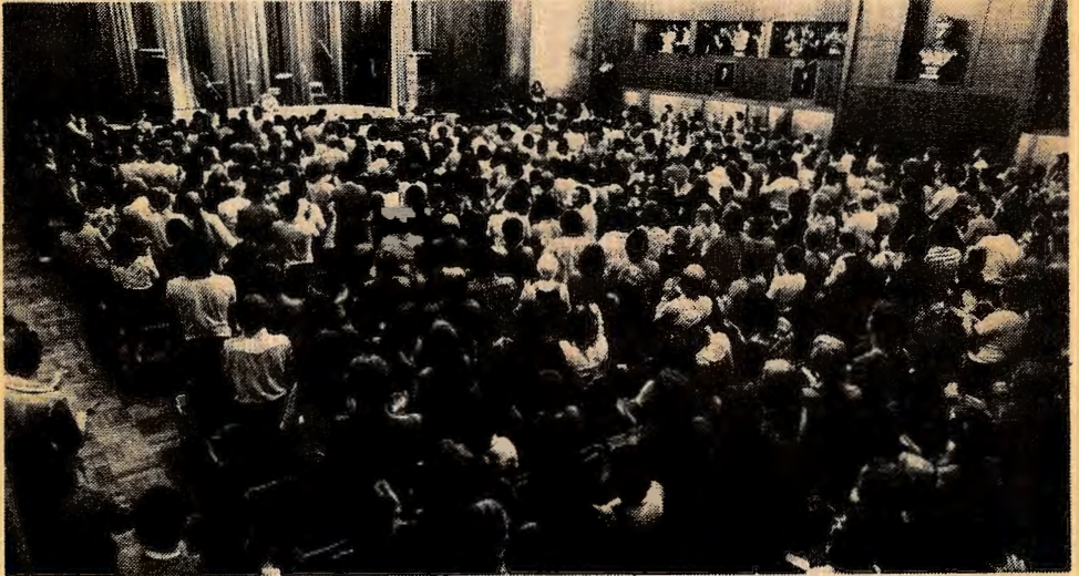
Fra Rød Valgallianses valgkampstartmøte i Oslo i juni.

som tvert imot ikke gir andre løfter til valget enn at de vil støtte de kampene arbeiderklassen sjøl fører mot borgerskapet, og at de vil gjøre sitt beste for å avsløre de parlamentariske organene for det de er, nemlig redskaper som