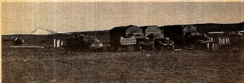
Bildet er fra den sovjetiske Kap Heer-basen på Svalbard.

Det at det dukker opp partier som kaller seg arbeiderpartier, men som egentlig går borgerskapets ærend er ikke noe nytt for vår tid.