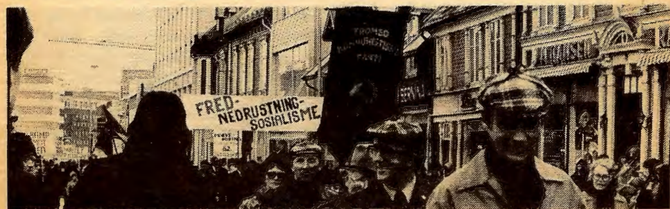
Fra «NKP»-seksjonen i 1. mai-toget i Tromsø i år.

avtaler og «nedrustningskonferanser» kan ikke skjule det som egentlig skjer, nemlig at begge imperialistmaktene ruster som aldri før. De rivaliserer om verdensherredømme og før eller senere vil de brake sammen i en tredje verdenskrig. Fredspratet har ingen annen funksjon enn Chamberlain og Hitlers «Fred i vår tid» rett før den andre verdenskrigen brøt ut. Når «NKP» spesielt i fagbevegelsen lanserer sine fredskomiteer må dette tas alvorlig og bekjempes. Det må avsløres at dette ikke har noen annen hensikt enn å dekke over sosialimperialismens aggressive hensikter.