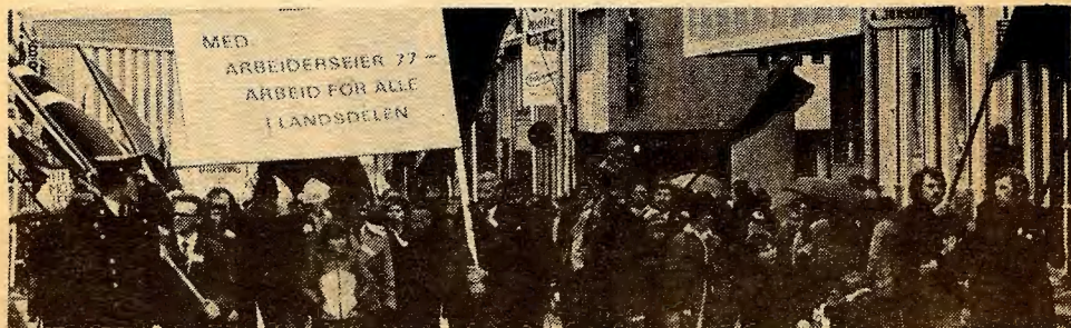
Fra fellestoget til DNA og «NKP» i Tromsø 1.mai i år.