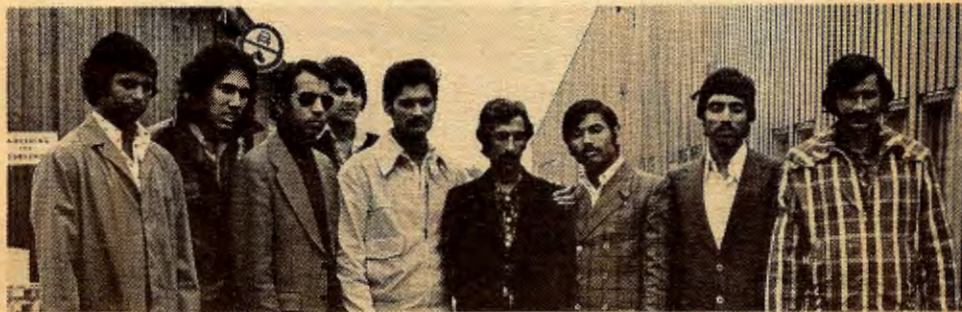
De ni fremmedarbeiderne ved «Norsk Champignon».

«Kommunistisk» Ungdoms «Kameratkveld» Midt under streiken hadde streikestøttekomiteen i Skedsmo et åpent solidaritetsmøte der de streikende deltok sammen med en god del folk som støttet streiken. I samme hus hadde det lokale «KU»-laget en såkalt «kameratkveld» der omlag 20 ungrevisjonister deltok. Det ble da bestemt at KUerne skulle inviteres ned på møte for å delta