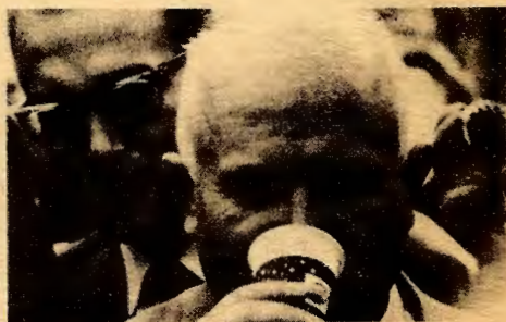
Sjefsideolegen bak SV-teorien om «fredelig overgang til sosialismen», Nikita Krutshov.

Tvert imot dette kan vi læra at arbeidsfolk alltid når dei har teke opp kampen for rettane sine er vortne møtte med valdsapparatet til den kapitalistiske staten. I dag skal det berre ein streik om høgare løn til før kølle-svingande konstablar og velutrusta opprørspoliti vert sett inn. Utallige revolusjonære