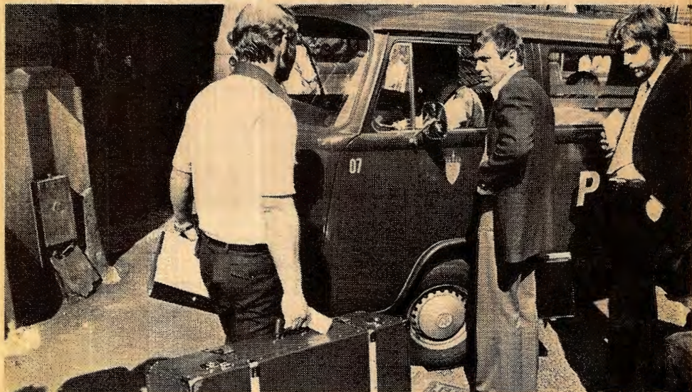
Politiet med det beslaglagte materiale fra SIPO-avsløringene som aldri kom lenger enn til Ny Tid redaksjonen, takket være SV'ernes feighet og uduglighet.

Dette sviket er nok eit døme på at arbeidsfolk aldri må ha tiltru til dette borgarlege arbeidspartiet. Dette sviket er så grovt at det aldri må verta gløymt, dette sviket må henga på dei for alltid og vera eit fåresignal for dei som har tenkt å røysta på dei i valet.