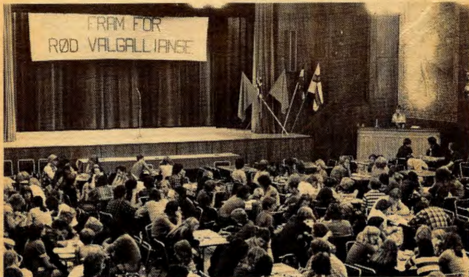
Fra valgkampmøte for Rød Valgallianse i Oslo.

Derfor må alle revolusjonære og progressive kasta seg ut i valkampen og slåst for mange røyster til RV og mandat etter valet. Det vil vera å venda ryggen til dei borgarlege arbeidarpertia DNA, SV og «NKP»!