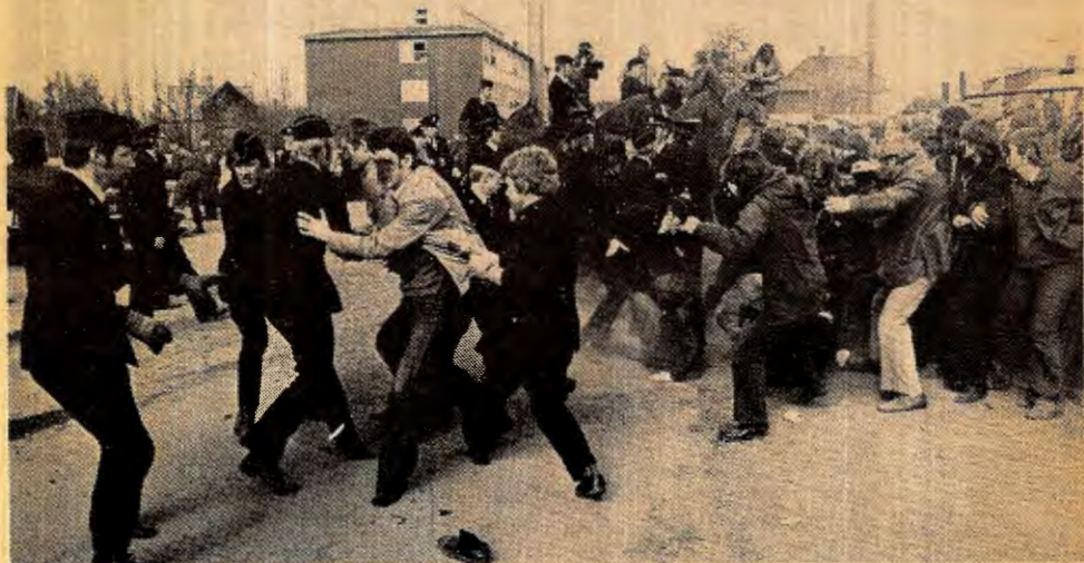
Linjegodsstreiken ble møtt med brutal politibold og grov trakassering. SV karakteriserte den militante og rettferdige streiken som en «gavepakke for høyresida».

Slik talar ekte borgarlege arbeidarleiarar. Det er folk som har som oppgåve å demma opp for alle progressive og militante straumdrag i arbeidarklassen. Skal SV spela rolla si ved sida av DNA kan dei ikkje alltid gå like ope mot dei kampane arbeidarane fører. I staden freistar dei å spreia mismot mellom dei framskridne og kampviljuge delane av arbeidarklassen. Oppgåva deira er å få arbeidarane til å missa trua på egne krefter. Difor «tyder» det ingen ting at 1976 var eit av dei største streikeåra sidan krigen. Difor «tyder» det ingen ting at politiet oftare og oftare vert sett inn mot arbeidsfolk. Det som «tyder» noko er at SV og DNA har fleirtal på Stortinget og at SV-pamper får ein plass ved sida av DNA i topporgana i LO. Slik fører SV-leiarane borgarleg politikk, ein politikk mot at arbeidsfolk skal reisa kamp mot utbygtinga.