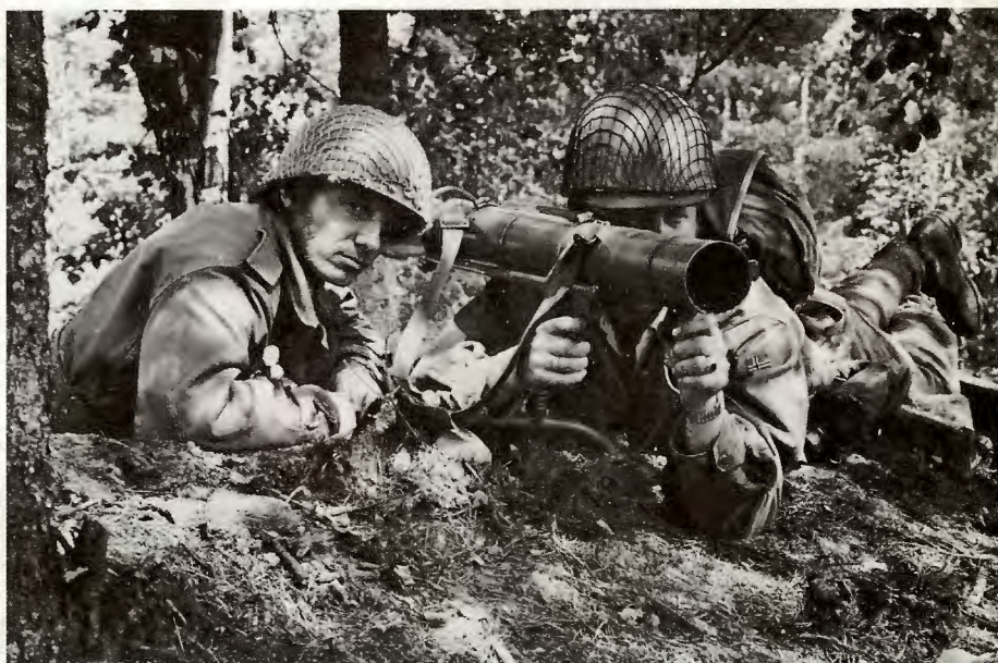
RV krever stående styrker i Sør-Norge, bedre luftvern og panservernvåpen.

RV krever utbygging av tilfluktsrom og nok midler til å hindre forfall av dem som fins. I Oslo er 30 000 av 57 000 offentlige tilfluktsromplasser ikke i stand. I nye drabantbyer som bl.a. Furuset fins ikke et eneste. Både sivilforsvaret og hele den sivile beredskapen må styrkes.