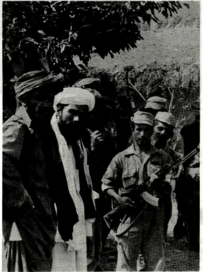
RV supports the liberation war against Soviet in Afghanistan.

روس اپنے تمام فوجی لادماً افغانستان سے باہر نکالے یہ آزادی اور قومی خود مختاری کیلئے سب سے اہم مطالبہ ہے R.V. (آر.و.ے) افغانستان کی قریب مزاحمت اور اس سے ساتھ یکجہتی کا جو کام ناروے میں ہو رہا ہے کی مکمل حمایت کرتا ہے اس طرح آر.و.ے - ناروے کا واحد محاذ ہے جو دونوں شہر طاقتوں روس اور امریکہ کا مخالف ہے ہم آل سائوڈار کے عوام کی امریکی سامراج کے خلاف جدوجہد کی حمایت کرتے ہیں اور P.L.O. پی. ایل. او کی آزاد فلسطین کیلئے جنگ اور اریٹریا کی جنگ آزادی کی حمایت کرتے ہیں