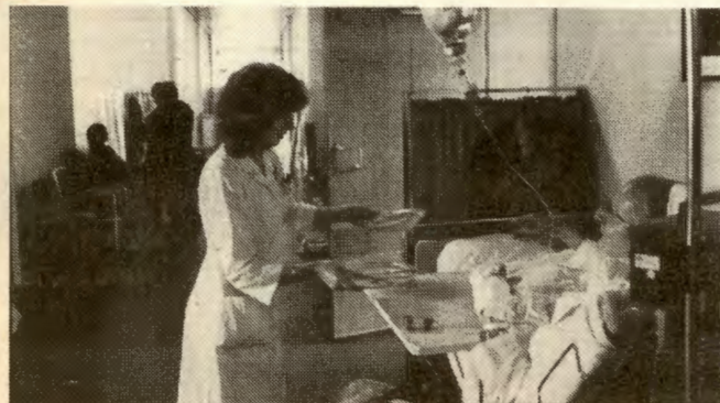
Korridorpatienter i Olje-Norge.

* 70% av RVs førstekandidater er kvinner. Vi garanterer at RV straks vil reise forslag om 6 timers normalarbeidsdag med full lønnskompensasjon.