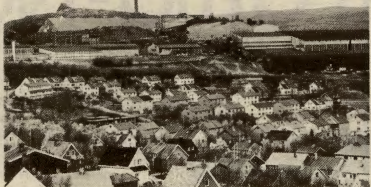
Sør-Varanger og Kirkenes. Det ville kosta staten under 1 milliard å redde dette samfunnet, ved å sanere gjelda og gjenoppta gråbergbrytinga.

Så er det en god del fagfolk som vurderer å flytte. Sveisere, reparatører, folk som har slått seg til her, men som er vanskelig å erstatte hvis de drar.