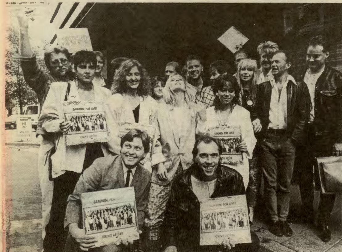
Solidaritetskonserter spilte inn mange millioner til Afrika i sommer. Men summen «Live Aid»-konserten spilte inn tilsvarer bare en kvart promille av den pengestrømmen som de neste fire åra kommer til å gå fra fattige, forgjeldte land til rike land i vest: 200 milliarder dollar.

delige formål: Til å støtte opp om Reagans Star Wars-program og aggresjon mot det vesle fattige Nicaragua. Det er hjelp til død i stedet for hjelp til liv.