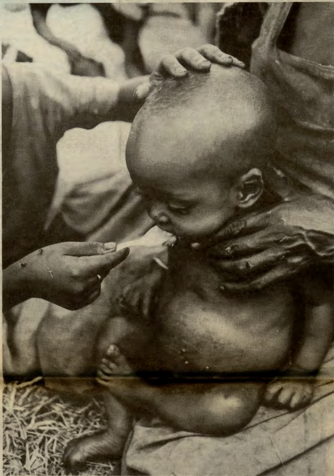
De fattige, forgjeldte landene i verden blir tvunget til å dyrke varer for eksport i stedet for mat til sin egen befolkning. I Afrika har matproduksjonen pr. innbygger gått ned siden 1970.

Mens vanlige folk gir penger til «Live Aid» disponerer makthaverne de enorme summene de rår over til de-