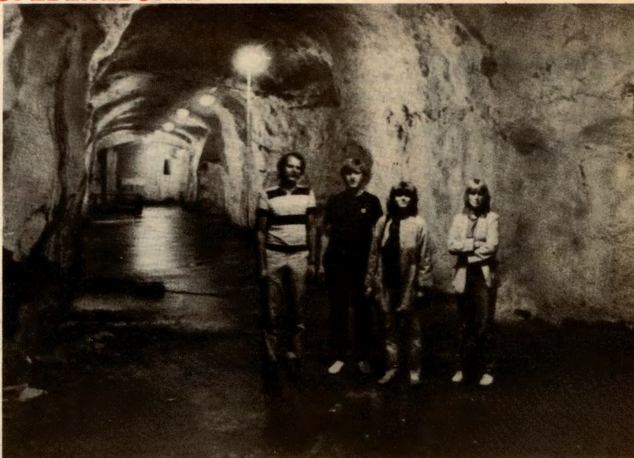
Tilfluktsrommet under Youngstorget: ikke godkjent!