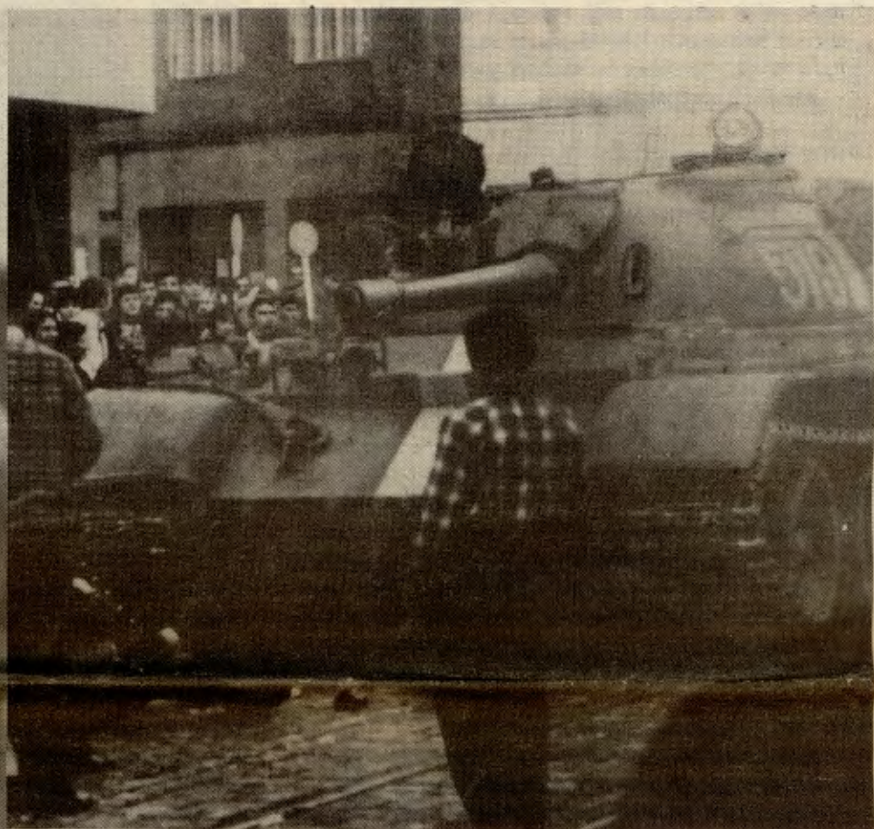
Tjekkosllovakia 1968 Afganistan 1980