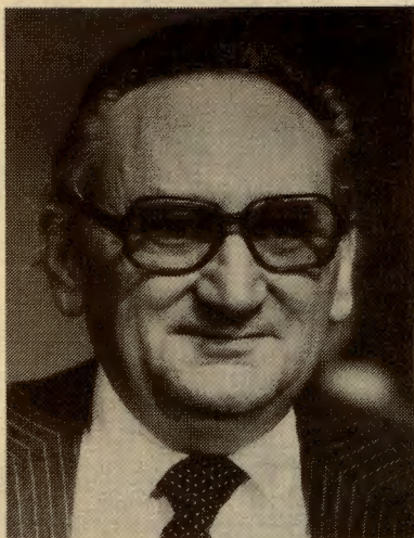
Egon Bahr

«Alle andre problemer, interesser, verdier og behov er sekundære i forhold til det viktigste spørsmålet: opprettholdelse av freden. M.a.o. ideologiske forskjeller, hevdelse av ens egne verdier, inklusive menneskerettigheter, kravet om folks selvråderett, inklusive det tyske folkets; alt må settes i annen rekke, for de kommer ikke til å ha en sjanse til å hevde seg hvis vi ikke unngår atomkrigen.»