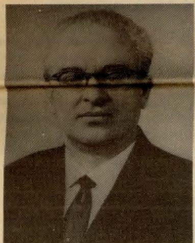
Juri Andropov: Foto: NTB

«Den første og eneste kampen er å redde oss fra atomvåpnene. Kan vi klare å fjerne dem fra kloden, så kan vi ta fatt på de andre problemene. Atomkrigen kan bryte ut i løpet av en time ved feilkopling. Vi har ikke tid til å løse så vanskelige problemer som f.eks. Afghanistan.» (Pressekonferanse etter Fredsmarsjen til Minsk, 2. aug. 1982.)