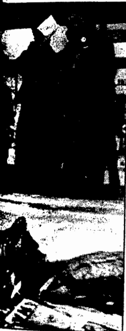
Farsund fekk ingen oppslutning i kommunestyret for framlegg om å ta kommunekassa betale bot for porno-aksjonistane.

Ordførar var glad for at diskusjon om pornobål hadde blussa