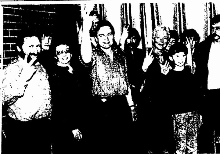
Sjølvsjøl om det ikkje vart gjort noko vedtak om at det skal byggjast ny veg til Åsen etter ein heilt ny trase, rammte frå Åsen stort sett negde med signala som kom fram i kommunestyret. Etter deira syn er tueli å satse på opprusting av eksisterande veg.

Breidda på vegbana held med naud til skulebuss og tankbil, men her er jamgodt med inga plass for grøtt på oppsida av vegen. Dette fører til ein leveleg kamp mot isvullane for vegvaktaren, heiter det. Og konklusjonen er altså heilt klar at det må kome veg etter ei ny linje.