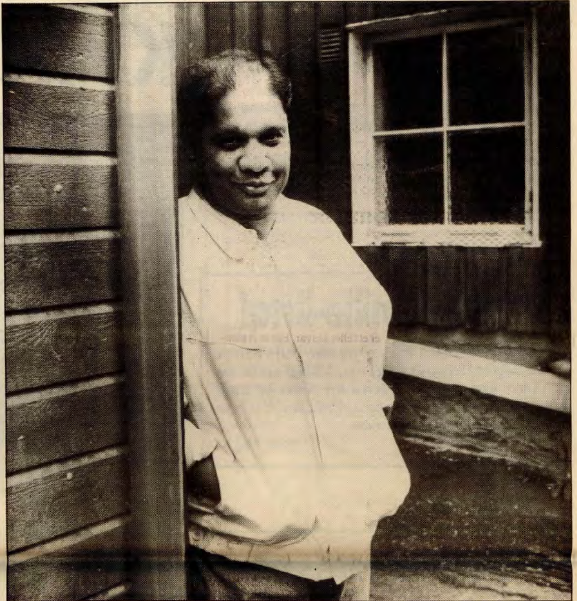
Sivarajah fra Sri Lanka er fiskerirettleder i Tromsø, og står på 6. plass på Fylkeslista. Han vil stoppe rasismen mens det ennå er tid.

Og utvandringa og avfolkinga av Finnmark og kyst-Norge som foregår nå, hva er det annet enn «økonomiske flyktninger» som presses til å dra sørover når livsgrunnlaget raseres?