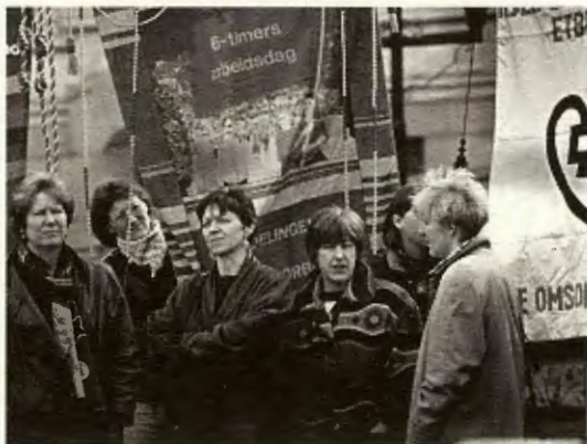
RV meiner 6-timersdagen vil gje folk ein betre kvardag