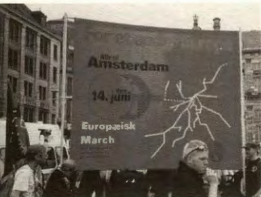
Kampen mot EU fortsett over heile Europa