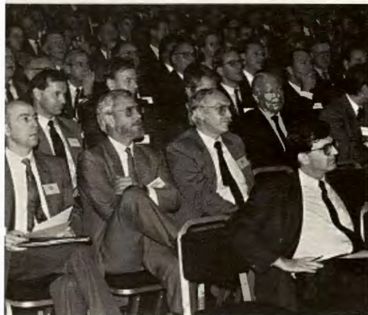
Noreg er eit paradys for folk med pengar