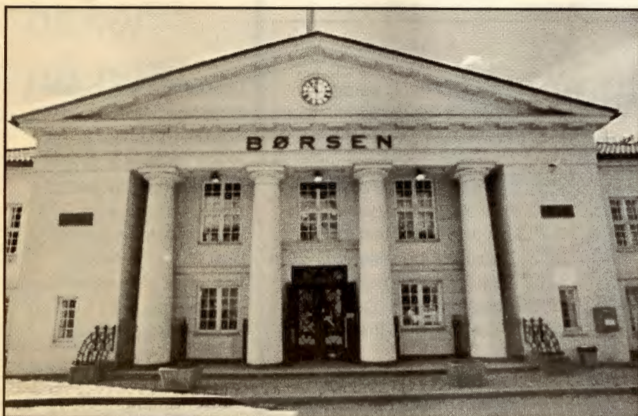
Det må være folks behov -og ikke børs som styrer velferdstjenestene