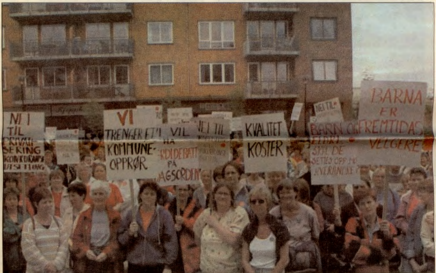
Folk i Nittedal demonstrerer mot forverring i kommuneøkonomien