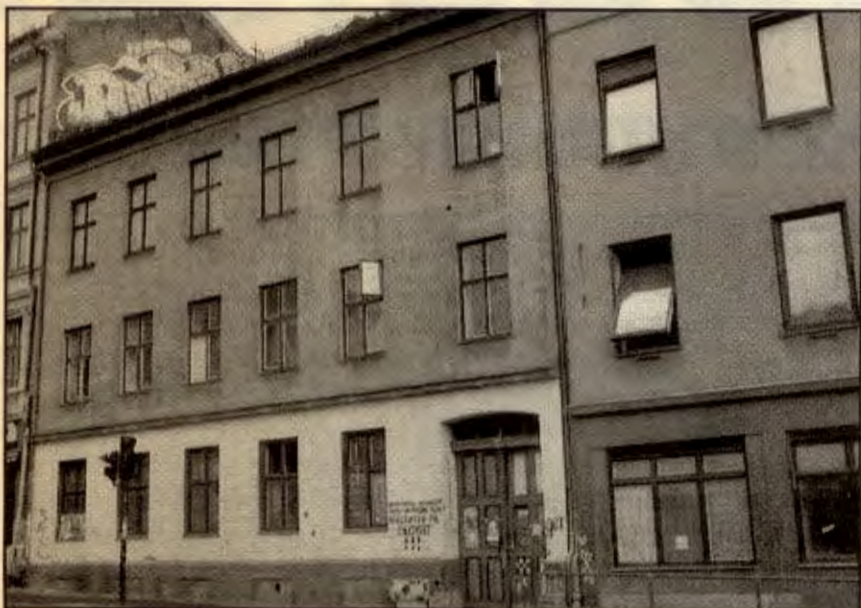
Fra den okkuperte bygården Hausmannsgate 48 i Oslo. Regjeringas boligpolitikk tvinger ungdom til å handle sjøl

Gjennom 90-tallet har folk fått oppleve en enorm prisvekst på boligmarkedet, som gjør at det som før var en selvsagt ting - at bolig er en menneskerett, ikke lenger er noe å ta for gitt. I dag er boligmarkedet så tøft at mange ikke har råd til sjøl å kjøpe seg noe sted og bo, og ender opp med å bli flådd på leiemarkedet.