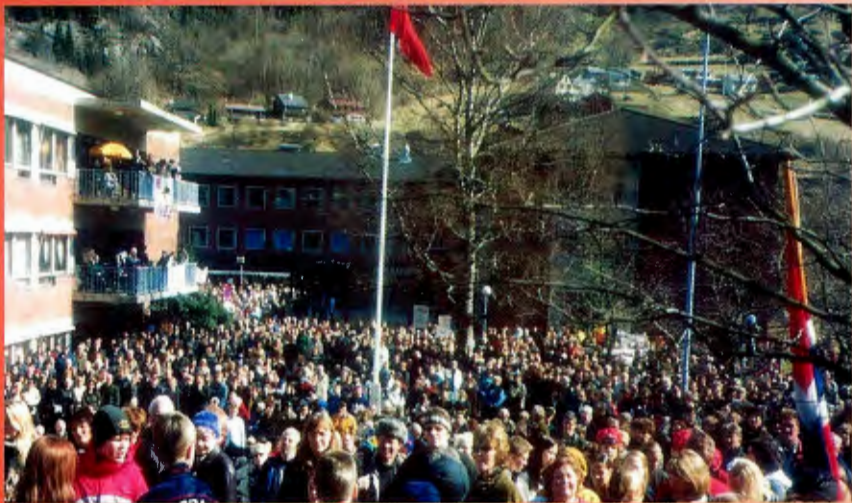
Sjukehuskampen – eit godt døme på tverrpolitisk og folkeleg mobilisering.