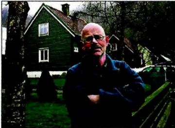
Faksimile frå Firda

Etter Rydalen fikk full innsyn i de dokumentene etter at han forklart seg i saken i retten. Dokumentene som rydalen fikk av høyanger kommun. de. de dokumentene som rydalen fikk av høyanger kommun. de.