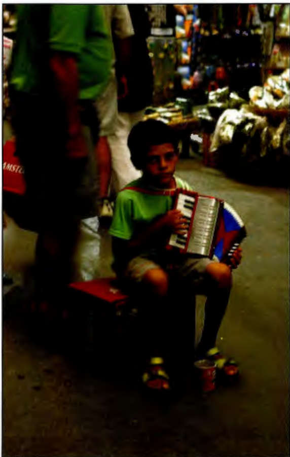
Ein liten gut må spele for småpengar til mat på den greske ferieøya Kreta. Er det slik vi vil ha samfunnet vårt?

I eit slikt samfunn vil ansvaret for arbeidsplassane og kommunen si utvikling ikkje vere hjå private aktørar, men hjå ein stat som styrer etter prinsippet om utjamning og demokratisering. I eit slikt sosialistisk samfunn skal born, ungdom, vaksne og eldre derfor føle seg heilt trygge på velferds- og hjelpe-tenester, og fellesskap, i alle fasar av livet.