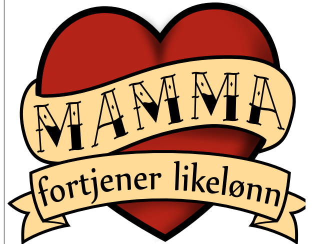
Mamma fortjener likelønn: Fra Rød Ungdoms likelønnskampanje våren 2010

tjenester, kvalitetsforbedring, bedre ressursutnyttning, bedre arbeidsmiljø, behov for utvikling Tanken bak modellkommunene, selve idégrunnlaget, er at de ansatte kjenner arbeidsprosessene, arbeidskulturen, samarbeidsrelasjonene og brukerne best. Derfor vil det ofte være de ansatte som har de gode endrings- og løsningsforslagene til å gjøre jobben og tjenestetilbudet bedre.