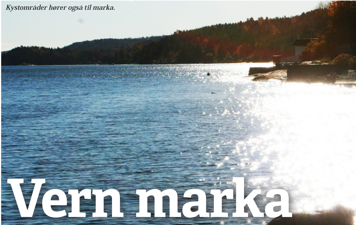
Kystområder hører også til marka.