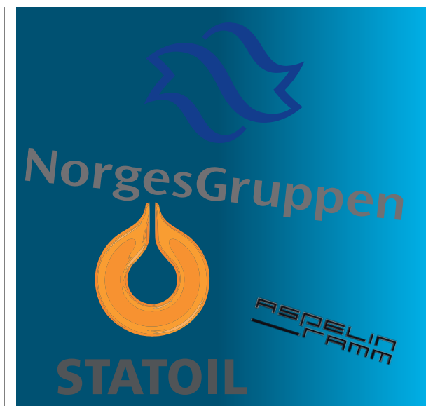
Hvor mange stemmer har disse 3 i kommunestyret?