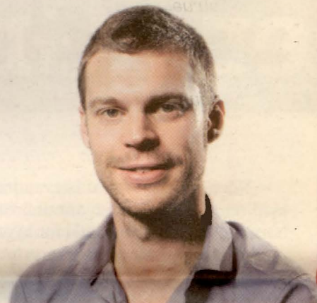
På første plass: Bjørnar Moxnes.