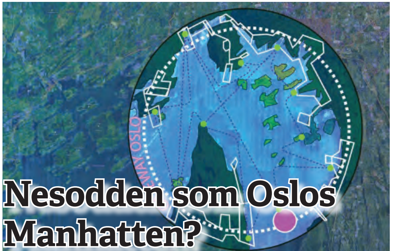
Illustrasjon fra Snøhetta

Hvis du sannsynligvis taper, er ikke folkeavstemning noe AP og Høyre går for. For disse er folkeavstemning bare noe du tenker på for å legitimere egen politikk. Ikke for at folk skal bestemme. Da må et mindretall kunne kreve folkeavstemning hvis de tror at et politisk flertallsvedtak er gjort i strid med folkemeningen. Den retten fjernet de. Nå er det bare aktuelt dersom flertallet tror de har en god sak.