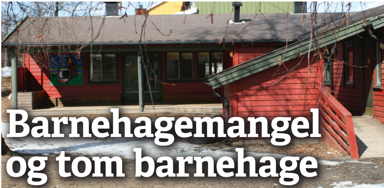
Mens mange ikke får barnehageplass står Blomsterveien barnehage tom.

I år blir det flere søkere og vanskeligere å få barnehageplass. Trykket er størst på Nordre Nesodden og Fjellstrand mens Berger og Fagerstrand har bedre dekning. Nedleggelsen av Blomsterveien barnehage i fjor sommer truer i år med å lage trøbbel, også for de med lovfestet rett til barnehageplass. Få med barn født etter 1. september kan regne med plass før høsten 2014. Lange reiseveier for noen barn er også et mulig resultat.