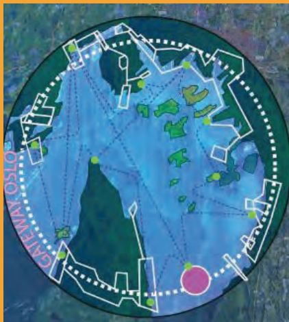
Stilleluføya som del av Fjordbyen (Snøhetta sin tegning) Øya sank i havet før den hadde forlatt tegnebrettet.