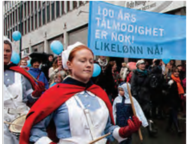
Fra 1. mai demonstrasjonen i Oslo 2012.

Angrepene i Europa, legger også press på politiske beslutninger og arbeidsliv i Norge. Derfor er det helt avgjørende at internasjonal fagbevegelse forener sin slagkraft. Det het en gang «Arbeidere i alle land – foren dere». Dette gamle slagordet er mer aktuelt enn noen sinne.