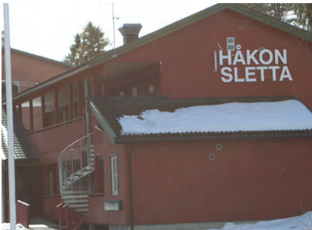
Her står mye tomt fordi kommunen ikke har penger til tilstrekkelig bemanning