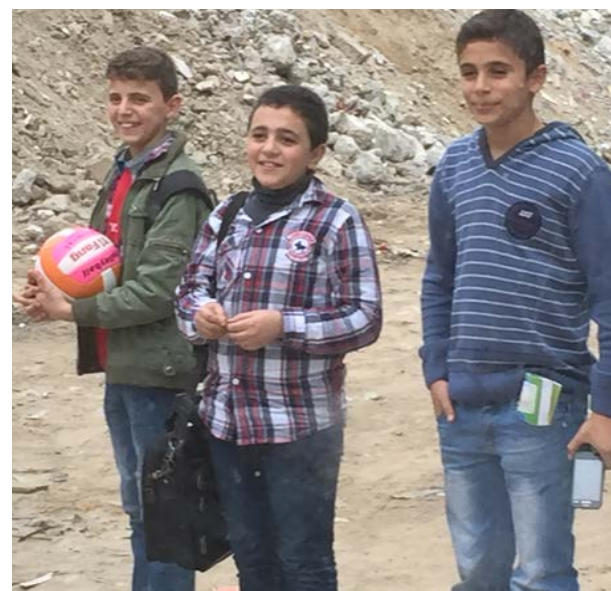
Palestinske barn.