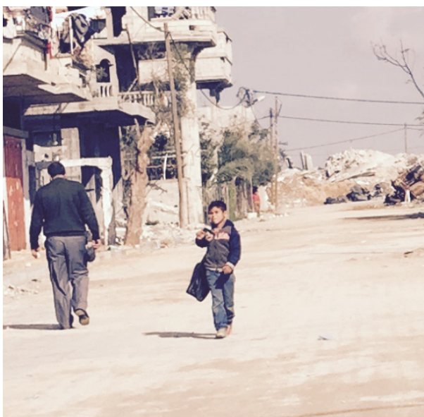
På vei til skolen.

På Nesodden forveksler Høyre og Arbeiderpartiet denne gamle romerske ordningen med «representativt demokrati». De mener at når kommunestyret først er valgt, så er det kommunestyret som bestemmer alt. 17 kommunestyrerepresentanter overprøvde f.eks. 7000 innbyggere som fremmet kravet om døgnglegevakt tilbake til Nesodden. «Fordi det er kommunestyret som er satt til å bestemme.» Det er en forståelse av «demokrati» som vitner om et selvbilde og en arroganse som ikke fortjener respekt eller støtte.