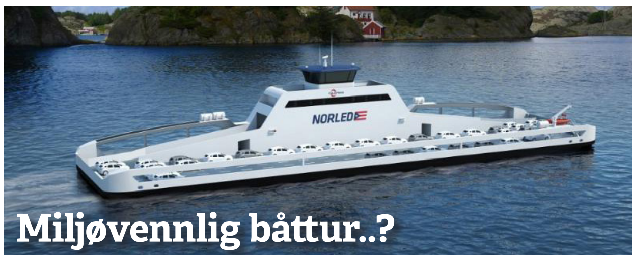
«Ampere» på tegnebrettet

Etter noen utsettelse ble Rødt sin interpellasjon om batteriferges på Nesoddsambandet vedtatt. Overgangen kan bli lettere enn antatt. Nåværende båter har elektromotorer som blir forsynt av gassturbiner. Enkelt sagt kan gassturbinene erstattes av batteripakker.