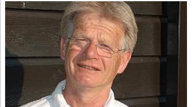
Sandberg og Gudmundsen utmerket seg ikke med å snakke sant før valget i 2011.