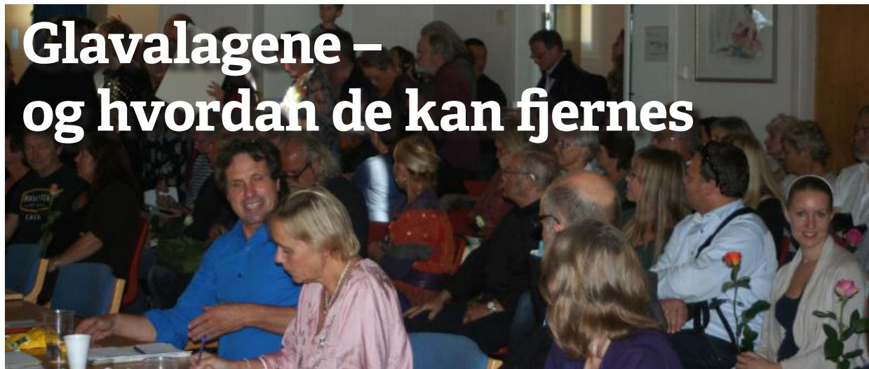
Mange var sinte da kommunestyret vedtok å se bort fra rådgivende folkeavstemning om ordfører.

Mange opplever det som vanskelig å kommunisere med Nesodden kommune. Informasjon og status om aktuelle saker er vanskelig å få svar på. Spørsmålene du stiller blir ofte returnert med at de er stilt til feil personer eller ikke er aktuelle. Sakene du vil ta opp i utvalg eller kommunestyret, hører ikke hjemme på dagsorden nå osv.