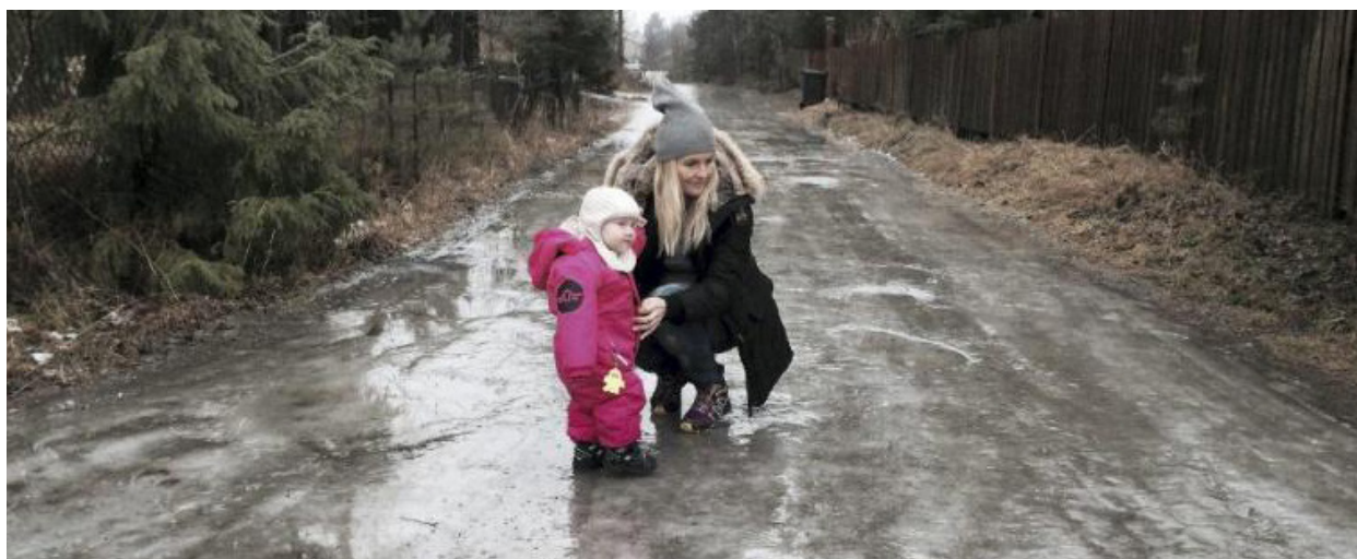
Asgerds vei utenfor Trollskogen barnehage i januar.

Velveier er ikke kommunens ansvar. Flaskebekk-tjernet renner tomt - men kommunen vil ikke gripe inn - har ikke noe ansvar. Legevakt er for vanskelig for kommunen å organisere selv. Gang- og sykkelveier klarer ikke kommunen å gjøre noe særlig med. Kommunen tar mindre og mindre ansvar. Dette er utvikling som går feil vei.