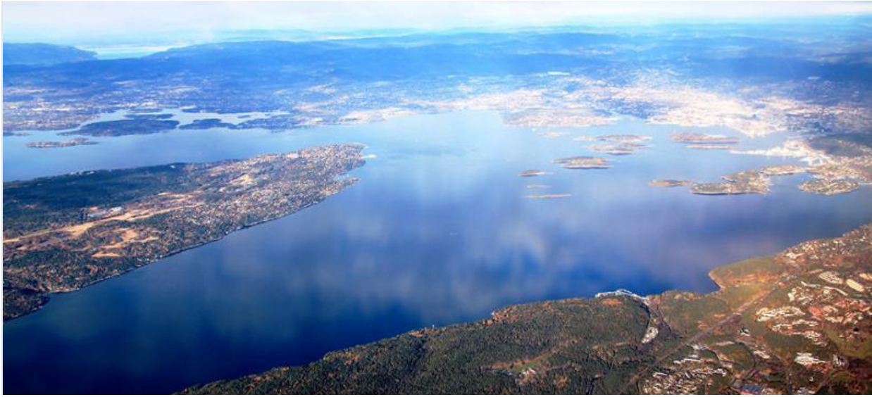
Midt i dette bildet ønsker Sweco å bosette flere hundre tusen mennesker.