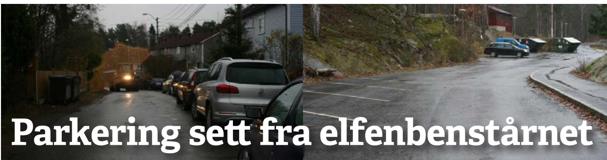
Mens parkeringsplassene i Kongleveien står tomme fylles Blomsterveien opp

Vi tror faktisk at planene er alvorlig ment og at de har tid til å vente på kommunereformen. Da er det viktig at vi på Nesodden ikke har politikere som i forhold til kommunesammenslåinger bare protesterer for all verden, men villig er med på ferden. På Stortinget er det stort flertall for å få til omfattende kommunesammenslåinger. Høyre, AP, Frp, Venstre og KrF støtter dette. Lokalt er det litt mere delt, men det er ikke usannsynlig at lokalpartiene er lojale mot sine moderpartier – i alle fall etter valget i høst. En målestokk kan være om de vil la avgjørelsen gå til folkeavstemning, eller om de etter valget bare vil la kommunestyret vurdere utredningene som kommer. Da vil beslutningen der i tilfelle avgjøre om vi i det hele tatt vil få noe valg til et kommunestyre på Nesodden i 2019.