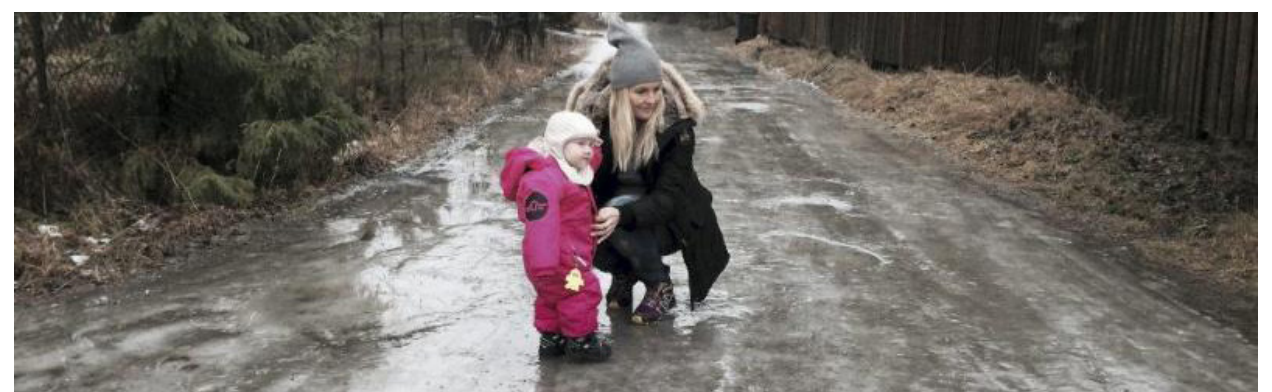
Asgerds vei i vinter: En av veiene kommunen vil avskrive seg ansvaret for.