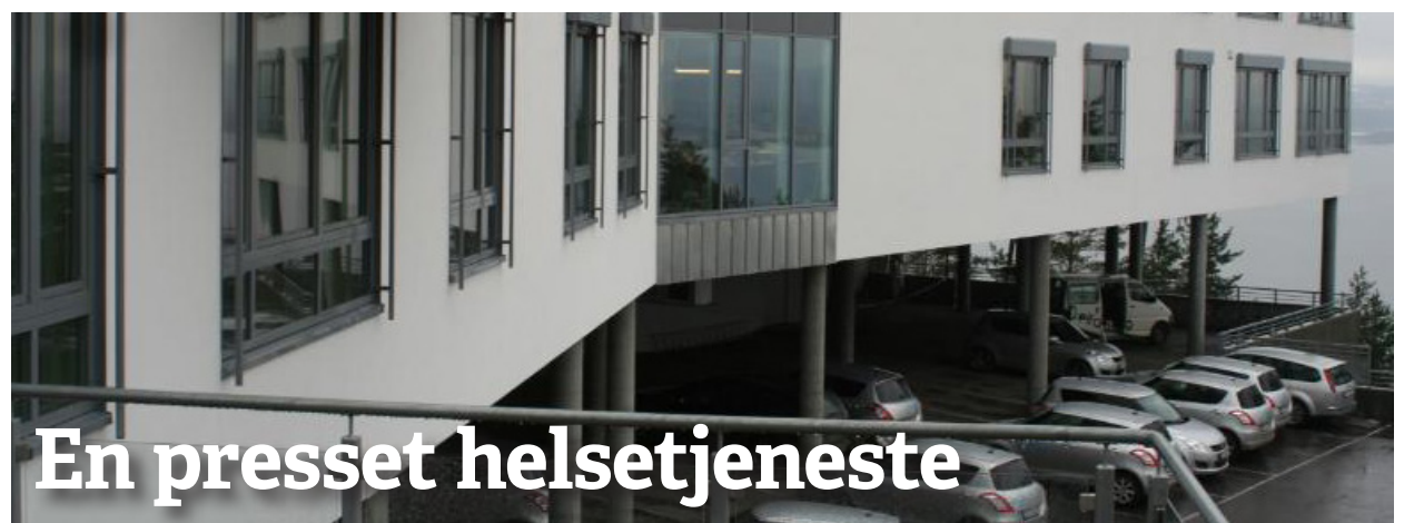
På Nesoddtunet står to av de nybygde avdelingene tomme. Det er stort behov for flere plasser, men budsjettvedtaket i høst kan bety at rådmannen ikke kan åpne ny avdeling.

Ideen om fattighus på Nesodden er dermed lansert, la gode krefter sørge for at vi kommer i gang i løpet av 2015, avslutter Sigmund.