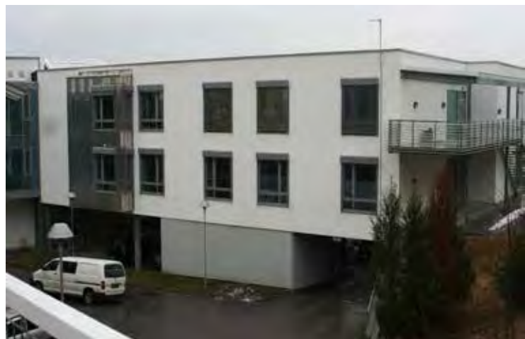
Nesoddtunet har plass til legevakt og vil nyte godt av samarbeid med legevakten

Motstandere av døgnlegevakt i AP og Høyre tyr til ufine triks for å skremme velgerne: