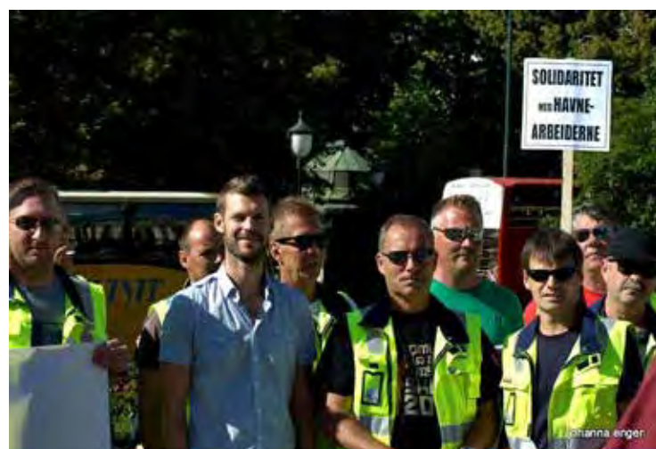
Rødts leder, Bjørnar Moxnes, i demonstrasjon sammen med havnearbeidere som sloss for tariffavtale.

I kommunestyret på Nesodden er det usedvanlig lite forståelse for faglige rettigheter. Få av kommunestyre-medlemmene har hatt en jobb på “gølvet”.