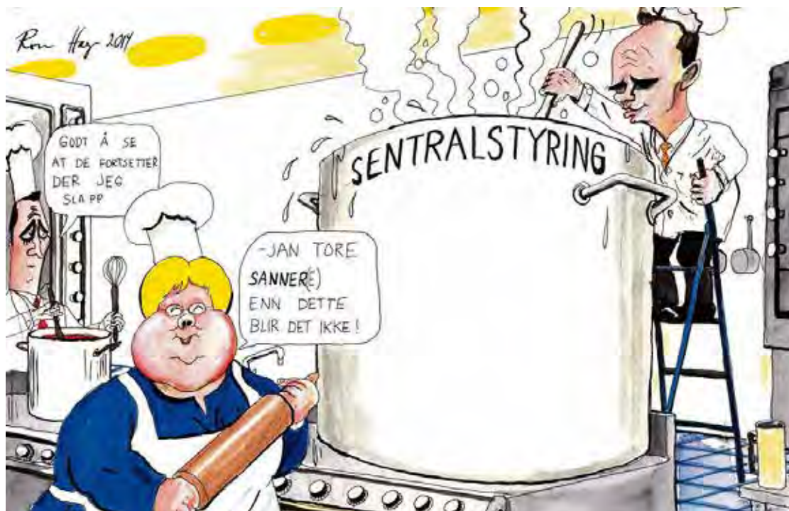
Tegning: Roar Hagen, VG

Det påstås at vi har for små og lite "robuste" kommuner. Men en rekke undersøkelser viser at folk er mer fornøyd med tjenestetilbudene i mindre kommuner, og at det også gjør det lettere for innbyggerne å påvirke. Nærhet til sakene gjør at folk engasjerer seg mer.