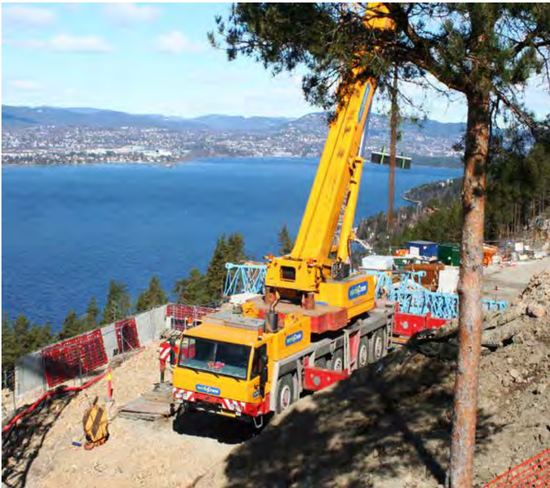
Utbygginger, slik som på Varden, blir unødige dyre

Det bygges for få og for dyre boliger i Norge. Spekulantene klager på tomtemangel, tungvinte reguleringsbestemmelser og kommunalt sommel. De bløffer Det er «det ufrie markedet» - spekulantene selv - som sørger for få og dyre boliger.